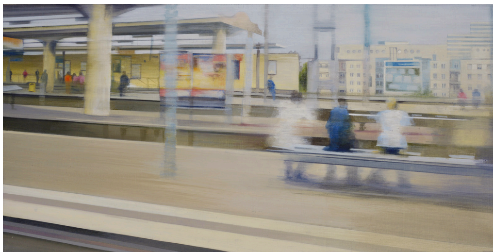
VITESSE - OBOLENSKY Acrylique sur toile

Il considère ces deux pratiques comme différentes, mais le sont-elles réellement ? Ce qui les unifie, c'est un plaisir évident, celui de peindre et poser la question même du rapport image-peinture. »