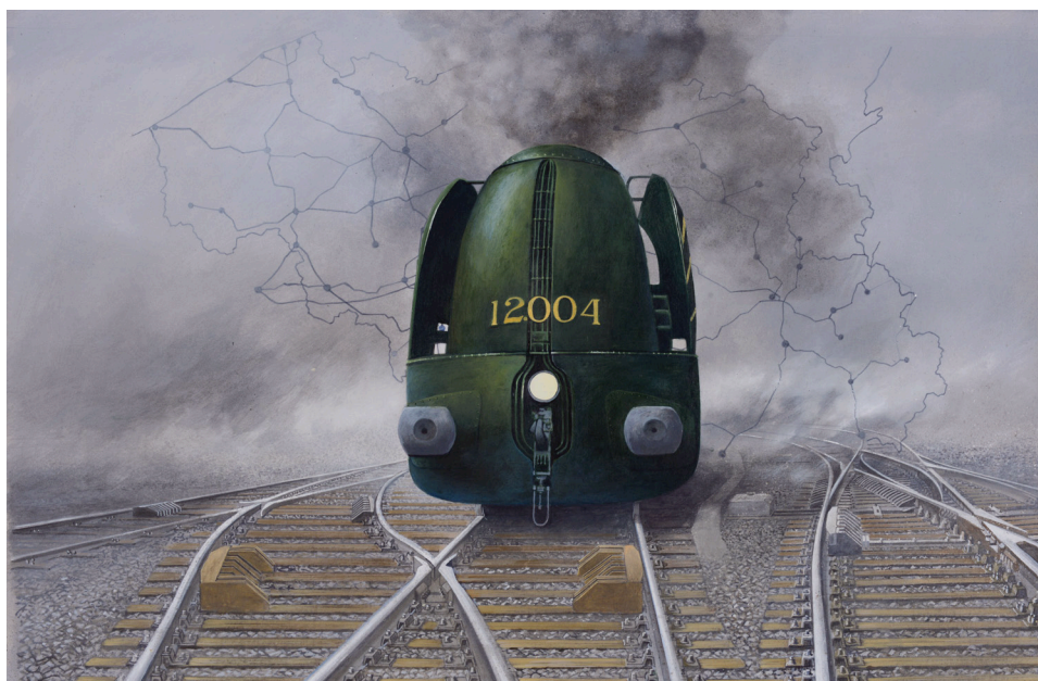
LA 12004 OBOLENSKY Acrylique sur toile

En 2009, alors que les contours du projet du Musée National du Train s'esquissent dans l'esprit de François Schuiten, c'est naturellement que celui-ci demande à Alexandre Obolensky de le suivre dans l'aventure. Les compétences du peintre sont à la hauteur du gigantisme des œuvres imaginées par Schuiten et son travail est placé au cœur du dispositif de Train World. Sous la direction scénographique de Schuiten, Obolensky donne vie aux idées les plus fantastiques de son créateur en réalisant l'intégralité des toiles et décors peints du musée.