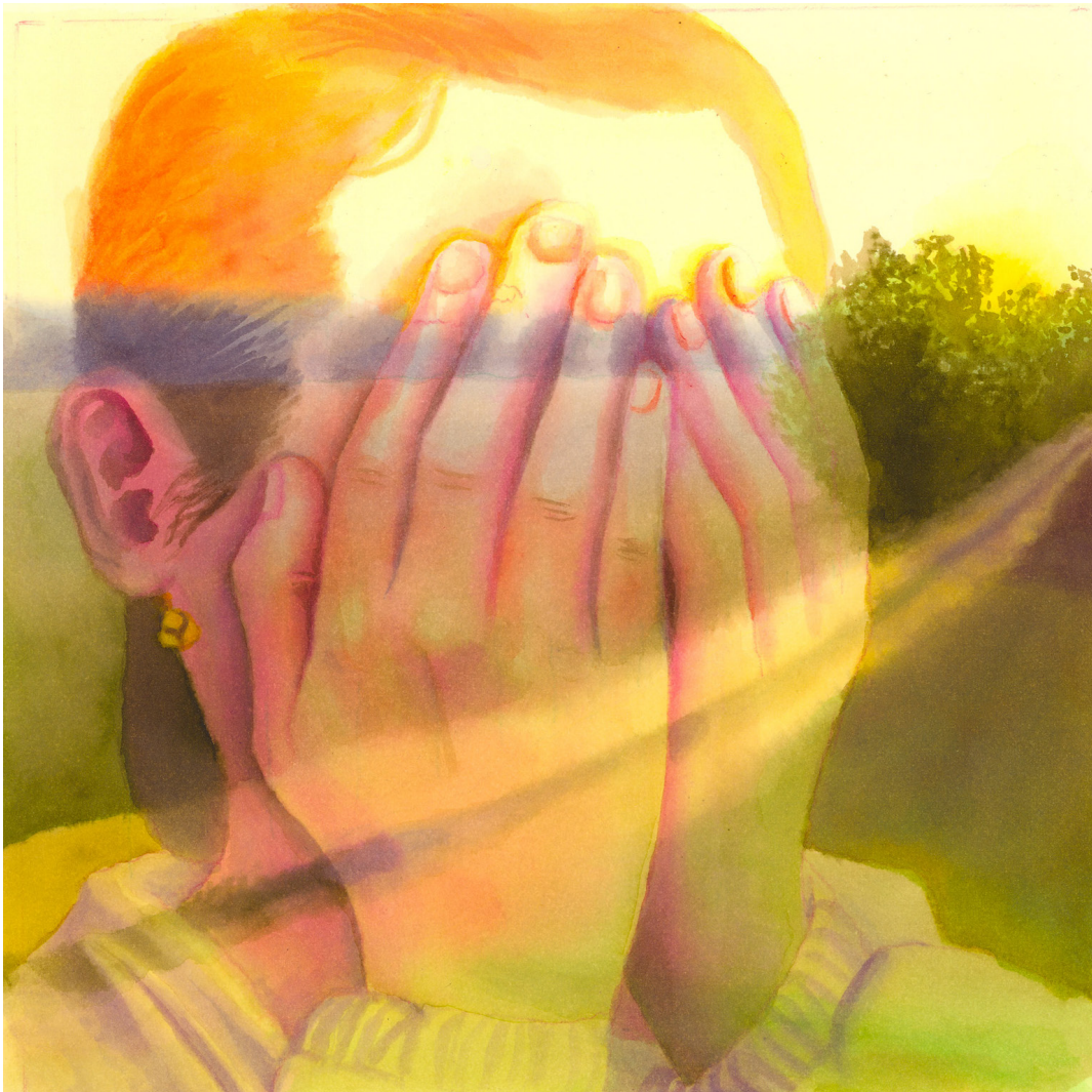
Maité Grandjouan - Tout doit disparaître , Aquarelle sur papier, 20 x 20 cm

La galerie Huberty & Breyne, Paris I Chapon est heureuse de proposer, dans le cadre de la programmation Mycélium, cette exposition de plus d'une centaine de dessins inédits du 23 novembre 2024 au 4 janvier 2025.