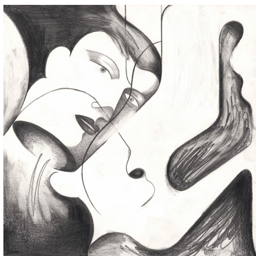
Fanny Michaëlis - Sans titre , Crayon noir sur papier, 20 x 20 cm, Signé et daté au dos

Les artistes sollicités n'ont pas une vision restreinte de leur pratique. Tous explorent de multiples formes graphiques et bousculent la notion de « frontières artistiques ». Du dessin unique à la série, de l'illustration à l'écriture d'une bande dessinée au long cours, chaque artiste revendique le dessin comme une forme expansive, poreuse et vivante, qui pulse et entre en résonance avec d'autres disciplines artistiques aux constructions formelles et plastiques variées.