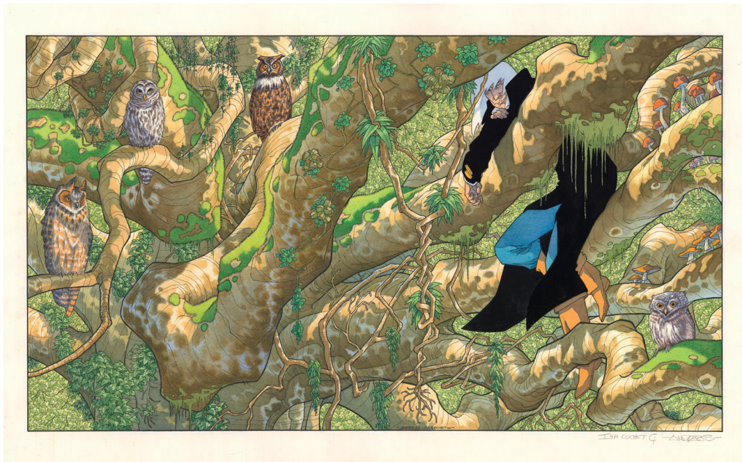
Rork et les hibous - 40 x 70 cm, Aquarelle sur papier.

Ces dernières années, il s'est consacré essentiellement à ses deux séries phares, Arq et Capricorne . Et l'approche de la soixantaine ne l'empêche nullement de conserver la fraîcheur et le goût du risque qui définissent son oeuvre aussi excitante qu'exigeante.