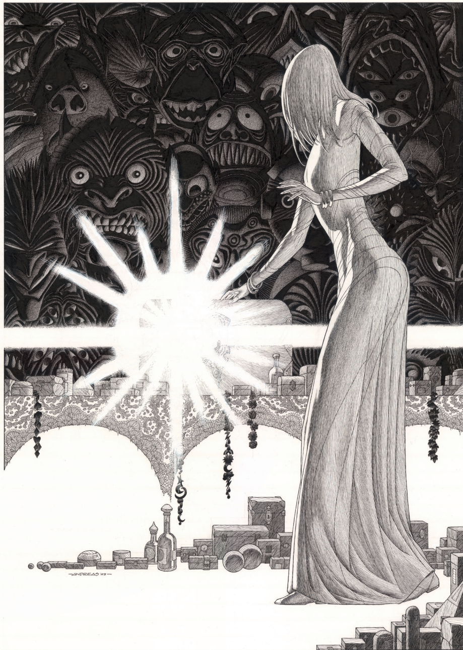
Pandore - 70 x 50 cm, Encre de Chine sur papier.