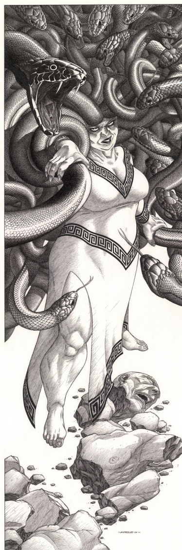
Gorgone - 90 x 30 cm, Encre de Chine sur papier.