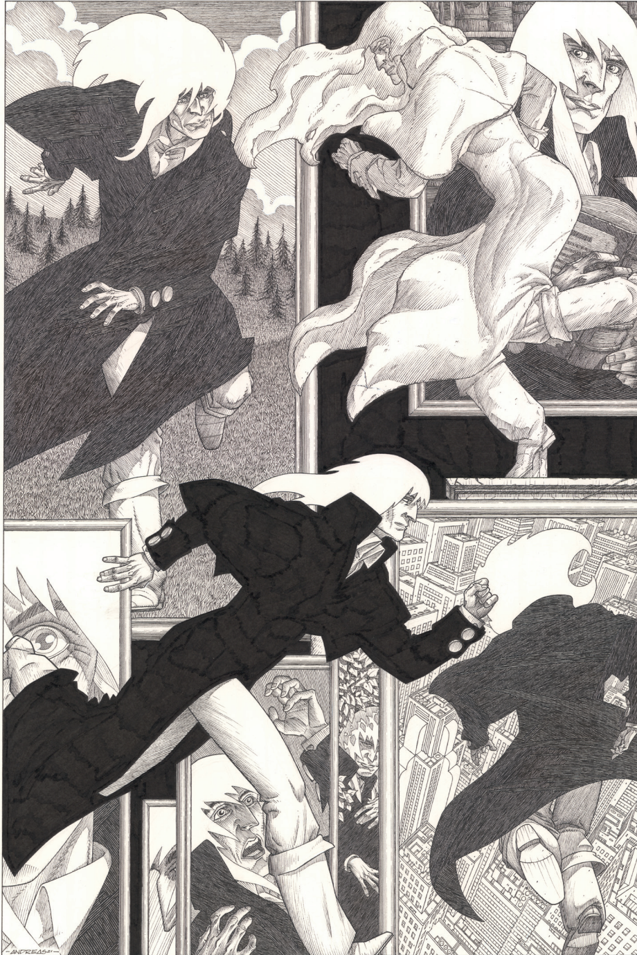
La course de Rork 2 - 60 x 40 cm, Encre de Chine sur papier.