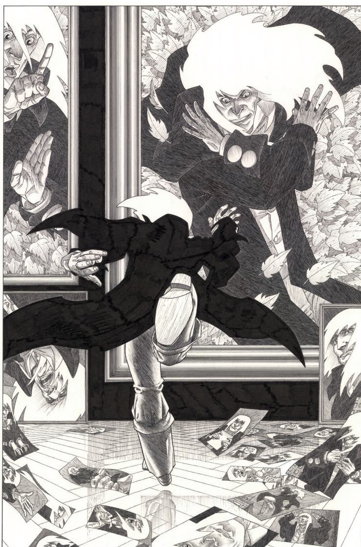
La course de Rork 1 - 60 x 40 cm, Encre de Chine sur papier.