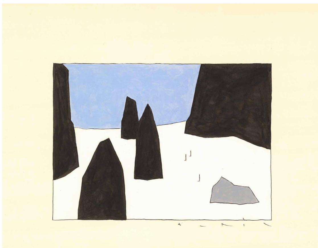
Bretagne bleue, III — 17,9 x 27,6 cm

Réalisés entre 2007 et nos jours, cette centaine de dessins propose, au fil d'une œuvre rare, une promenade merveilleuse.