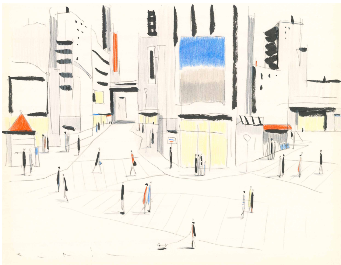
Tokio idea I — 25,5 x 35,4 cm

L'esthétique graphique et l'élégance de son univers ont fait de lui un artiste à l'identité remarquable dont les œuvres sont présentées régulièrement dans des centres culturels et des foires d'art, en France et à l'international.