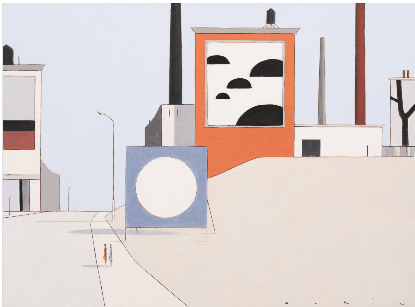
François AVRIL - Kunstruktion XIII - 2025 - Acrylique sur toile - 97 x 130 cm - Signé en bas à droite et daté au dos