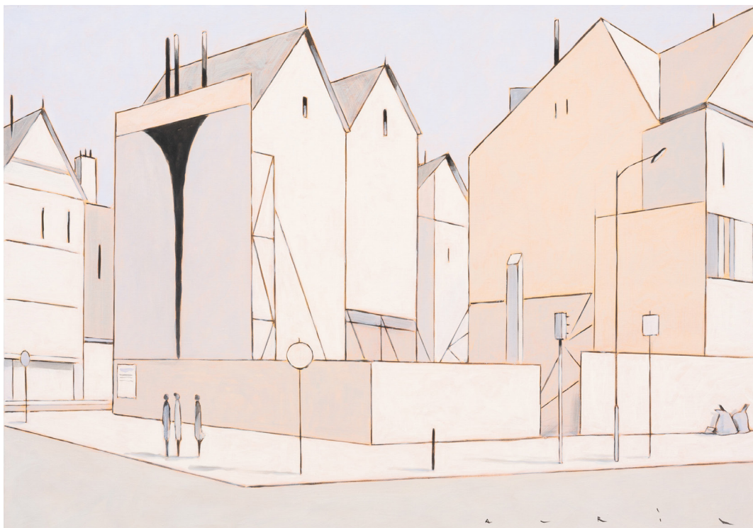
François AVRIL - Kunstruktion V - 2025 - Acrylique sur toile - 81 x 116 cm - Signé en bas à droite et daté au dos

Par un subtil jeu de couleurs et de lumières, l'artiste transcende ses paysages urbains en une rêverie graphique. L'harmonie chromatique confère à ses compositions une atmosphère singulière: il privilégie une palette lumineuse et claire, où les teintes douces instaurent une ambiance feutrée. L'homme y est souvent absent, ou simplement esquissé sous les traits de frêles silhouettes. Ce choix délibéré renforce la sensation de silence et inscrit ses toiles dans une dimension résolument contemplative.