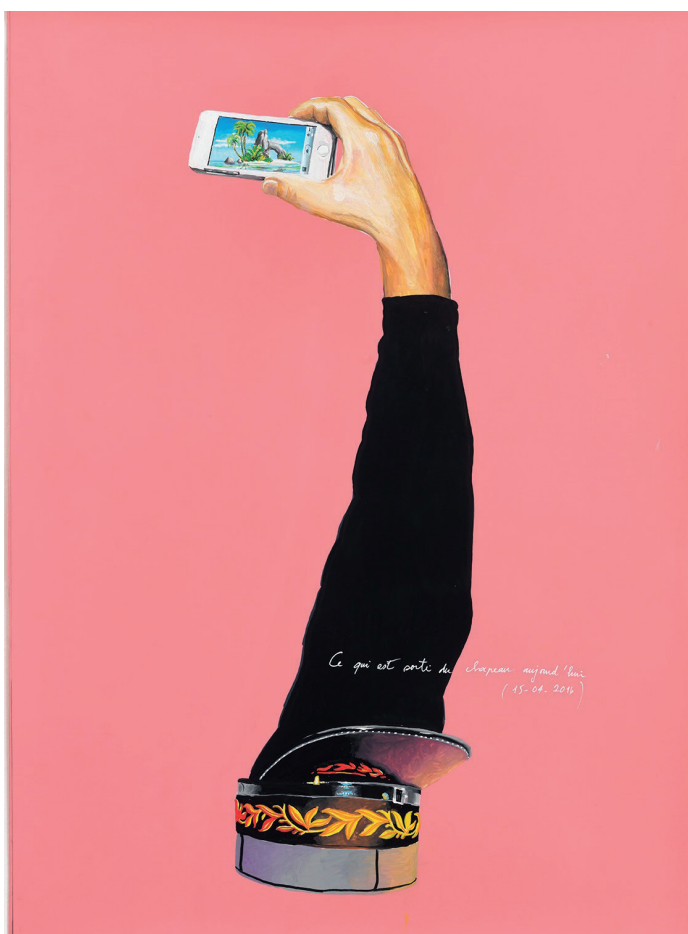
Ce qui est sorti du chapeau

Avec Propriétaire ? Locataire ? , Gilles Barbier signe une fois encore une exposition où l'absurde opère habilement, jusqu'à pousser le visiteur à explorer les cheminements de sa propre raison.