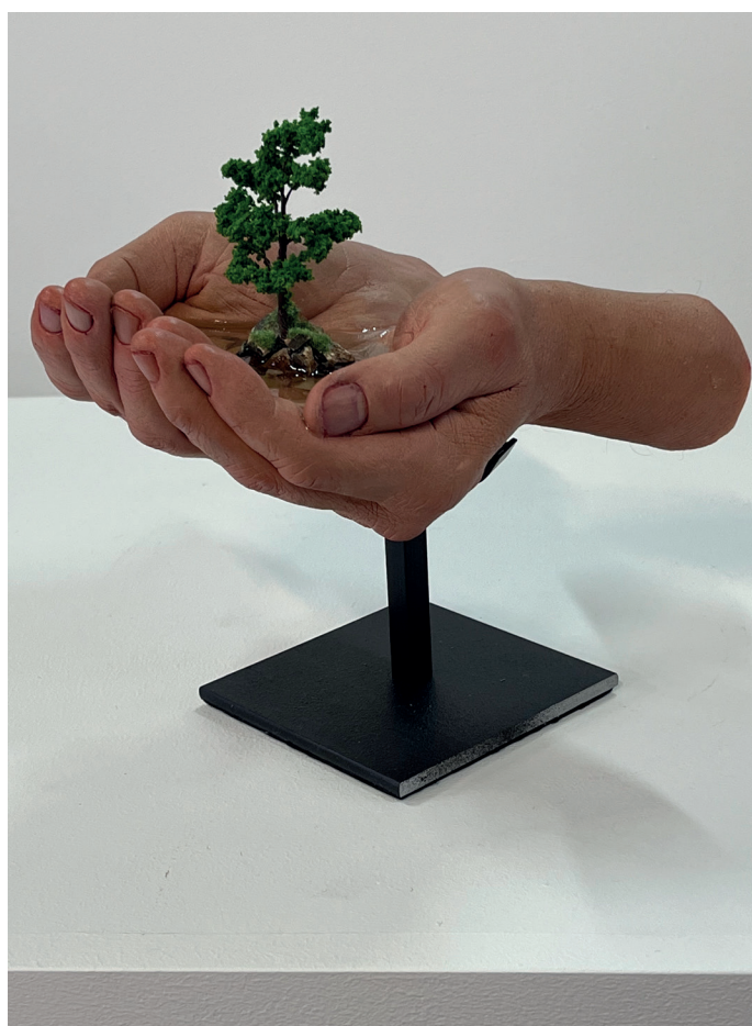
Offrir Une ÎLE