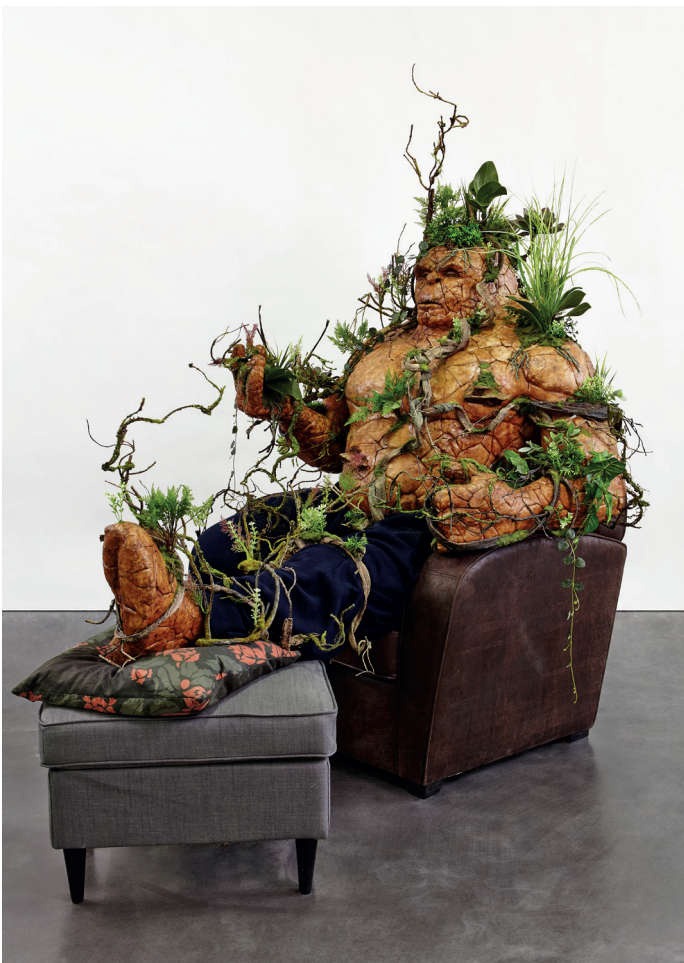
A very Old Thing — 180 x 180 x 115 cm