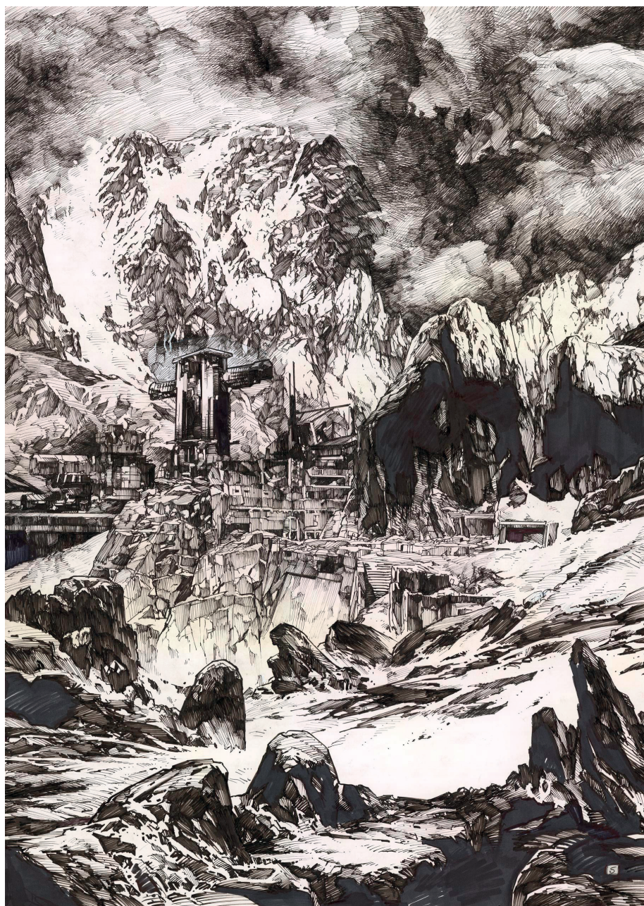
Inexistences - 65 x 46,5 cm

Parachevant des thématiques abordées dans Sanctuaire , Bunker ou Carthago , Christophe Bec livre avec Inexistences une œuvre fondamentale qui témoigne de son talent et de sa capacité à saisir le lecteur par les émotions, comme il le démontre encore en réalisant actuellement un Thorgal Saga .