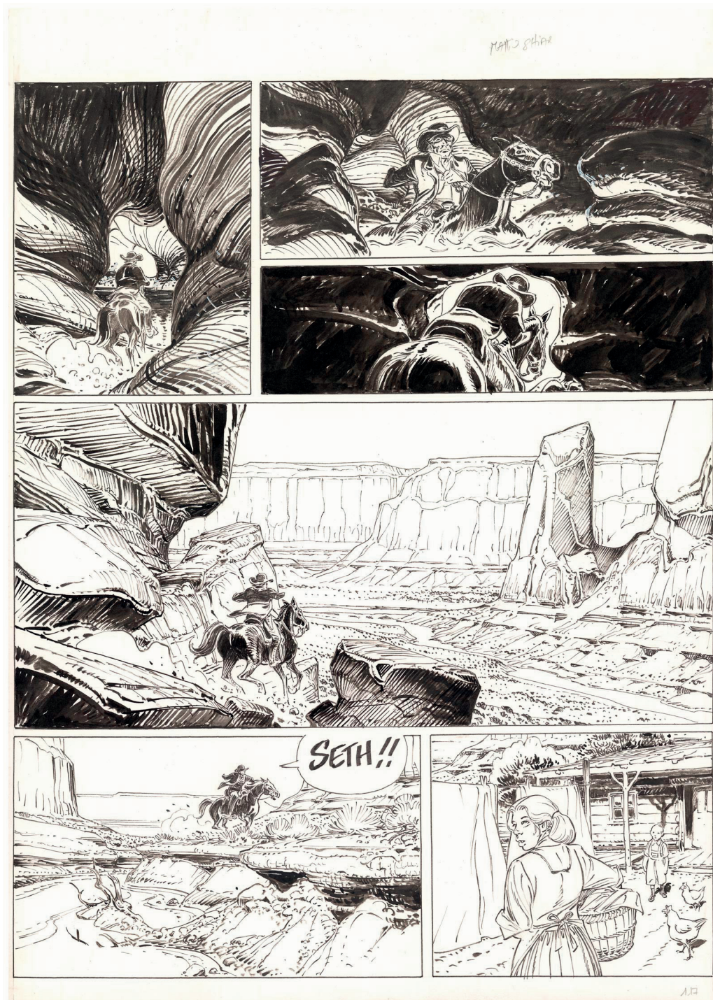
Bouncer - Hécatombe - Tome 12 - Planche 117 - 52,8 x 41,2 cm

Huberty & Breyne a le plaisir de vous présenter une exposition consacrée à Hécatombe (éditions Glénat) du 9 février au 9 mars prochain. A cette occasion, on pourra découvrir une sélection précise de planches originales de ce nouvel album de la série Bouncer , ainsi qu'une suite exceptionnelle de très grands dessins réalisés par François Boucq spécialement pour cet évènement.