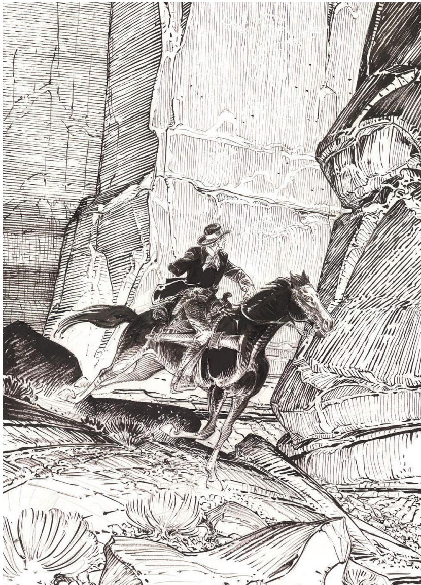
Bouncer - Dessin (détail) - 94 x 35 cm

Dans chacune de ses images, Boucq retranscrit de ses gestes le vivant en deux dimensions, donnant naissance à des évocations saisissantes. Le format de ses images permet au geste de l'artiste de prendre toute son ampleur. Ce mouvement se voit jusqu'aux densités d'encre s'amenuisant au fil du trait du pinceau. L'énergie employée pour leur réalisation accroche l'œil, trouve un écho chez le spectateur qui se trouve happé par la scène présentée jusqu'à, parfois, se perdre dans l'image. François Boucq est un grand maître du neuvième art. Ces pièces, s'il en était encore besoin, en sont la démonstration la plus évidente.