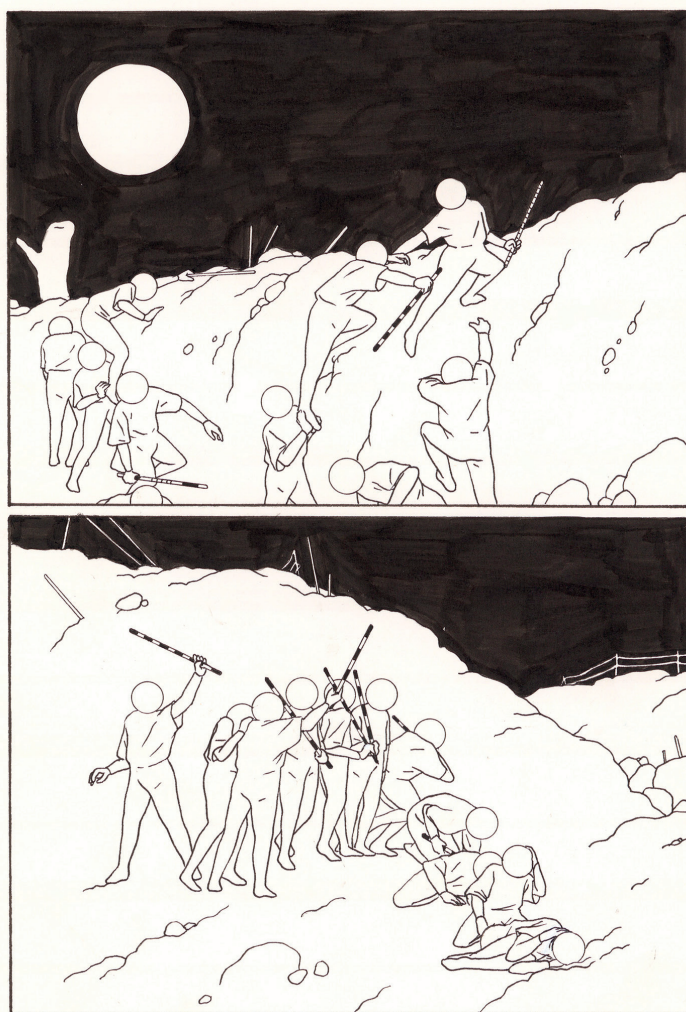
La fée Morgane IV - 24,6 x 16,7 cm

les laisser apparaître sous une autre lumière. Il fait le choix d'une palette de couleurs subtile et réduite pour retranscrire la lumière intense et froide des paysages du Nord, celle d'un « soleil d'hiver » (nom qu'il donne à sa maison de micro-édition en 2017) et nous offrir un dessin hors du temps. Le texte, lui aussi épuré, parfois laconique, est typographié « à l'ancienne », simple et droit. Lucas Burtin aime cette possibilité qu'offre la bande dessinée de mettre en travail le visuel par le biais du langage. Le dessin et le texte sont alors deux composantes qui se confrontent l'une à l'autre. Si le trait raconte quelque chose, le texte peut nous emmener ailleurs et la séquence tout autant. Entre décalage et complémentarité, le texte et le trait infusent, entrent en tension pour un duel ou un pas de deux et sont autant d'amorces à de nouveaux récits pour peu que l'on prenne le temps de contempler.