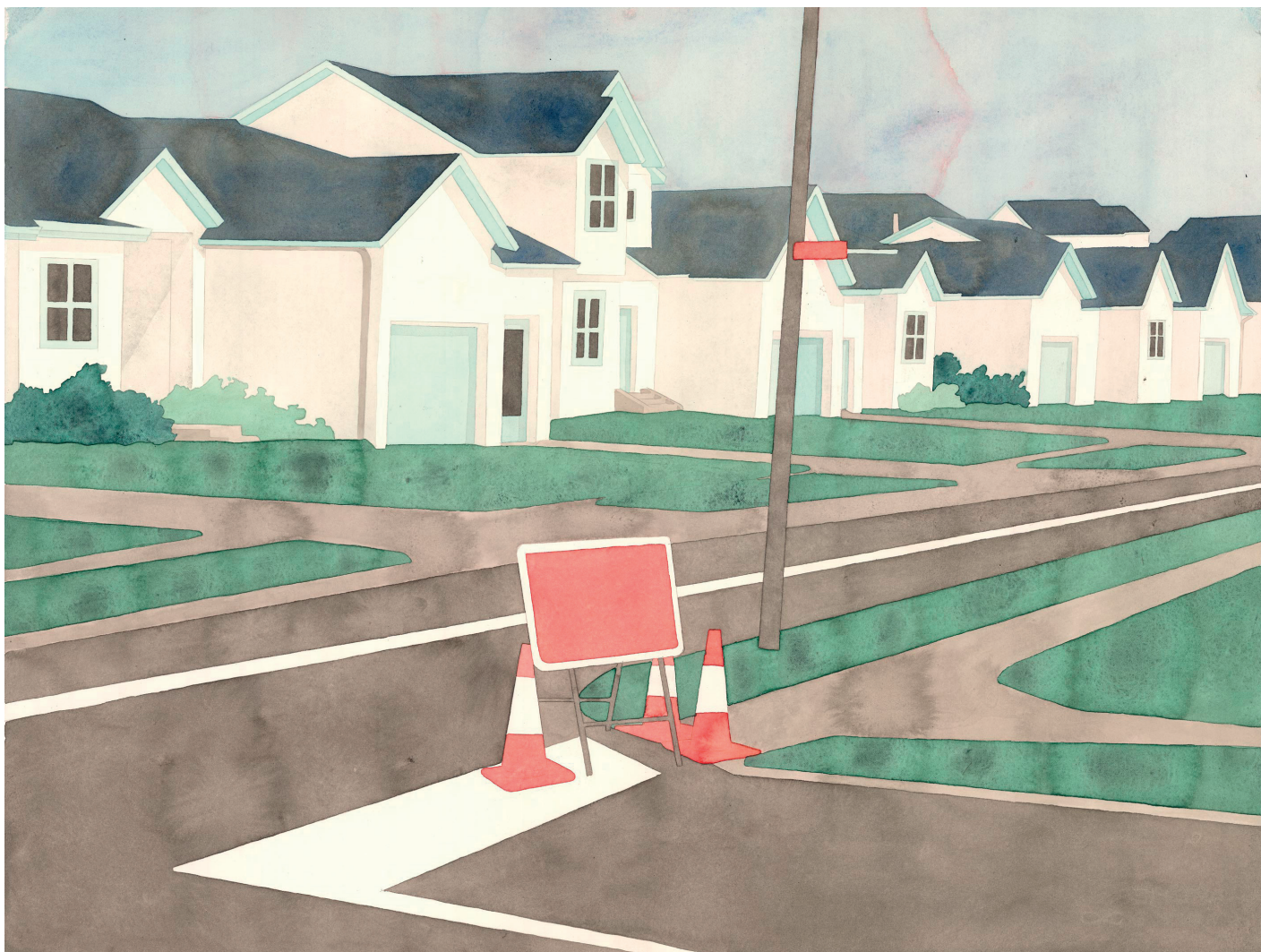
Panneau - 50 x 65,5 cm

Aussi, exposer le travail de Lucas Burtin, c'est créer une résonance entre des images uniques ou séquentielles, entre des œuvres originales et des reproductions risographiées. C'est n'établir aucune hiérarchie entre la planche, l'illustration et le dessin, faire cohabiter les techniques pour offrir de nouvelles correspondances visuelles dans un ensemble saisissant.