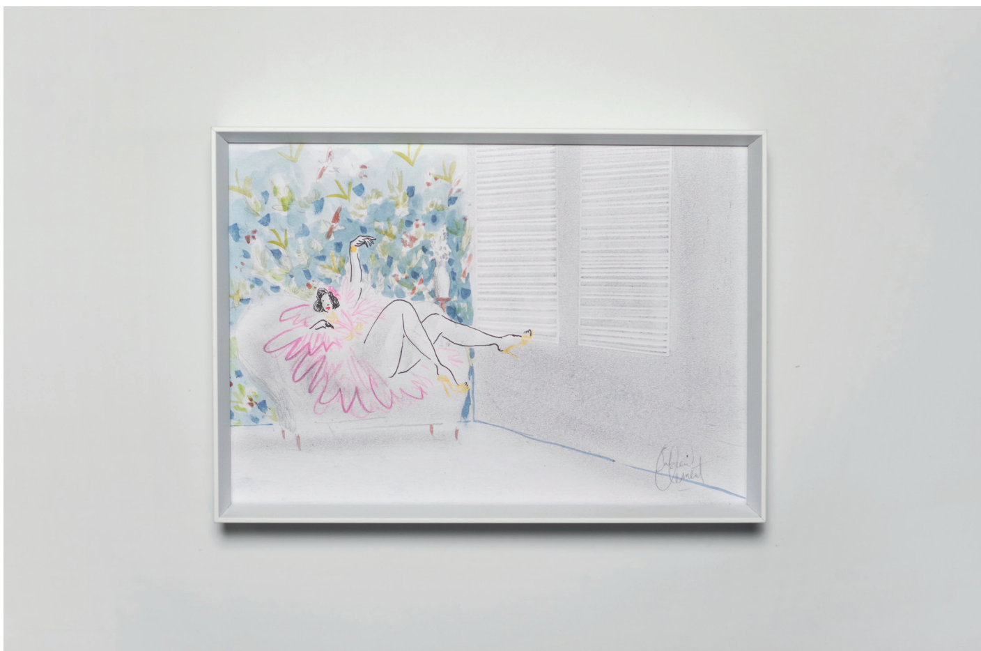
Tel de vlinders in de kamer - 148 x 210 mm

Peau , un titre court mais néanmoins imposant sur la couverture de ce livre qui semble nous promettre une lecture comme une lente dissection. Deux personnages, Esther et Rita qui se dévoilent ou se cachent au fil d'une histoire toute en subtilité. Comme dans un ballet de patinage, les deux protagonistes marquent la glace de leurs propres lignes : parallèles, symétriques ou chaotiques, parfois ténues ou abîmées. C'est le dessin qui fait se croiser leurs trajectoires.