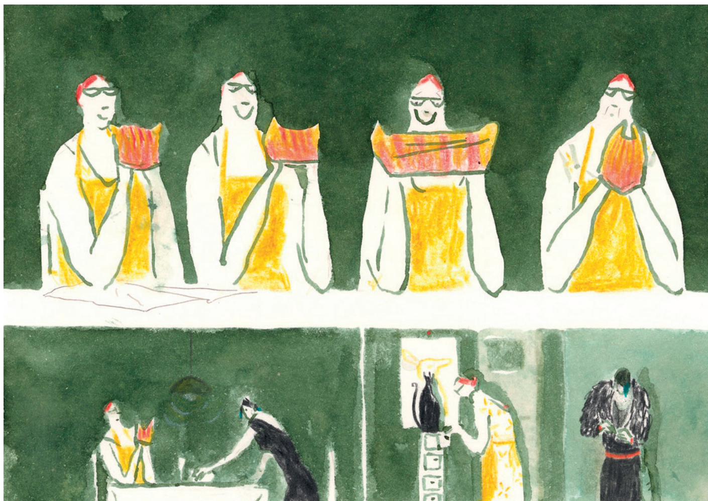
Peau - Page 61 (détail)