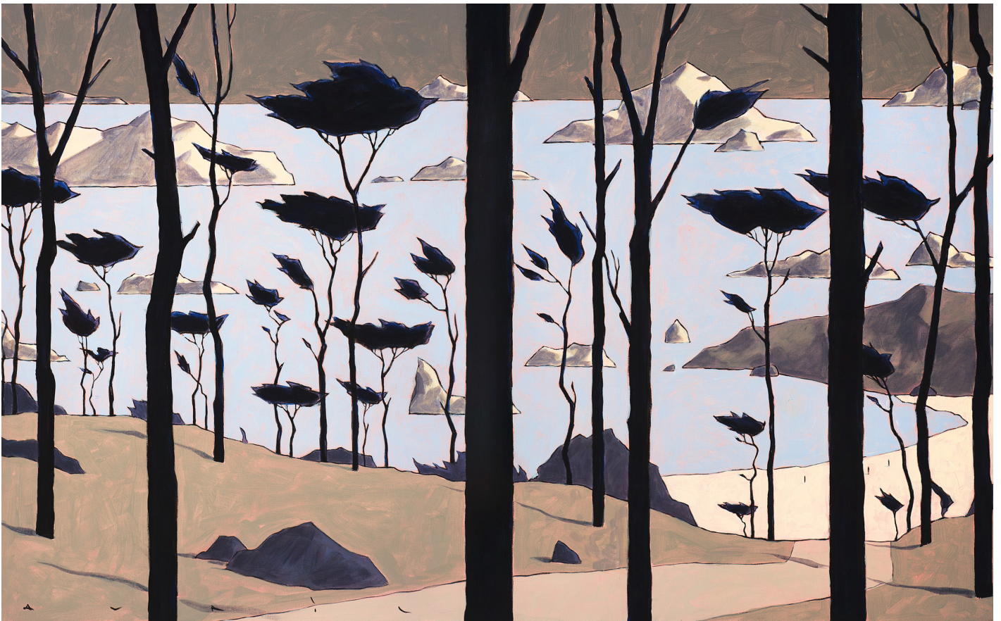
January III, 2020 Acrylique sur toile, 81 x 130 cm