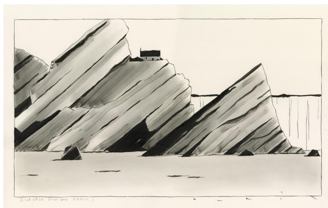
Isolated Houses, 33, 2019 Encre de Chine et crayon sur papier, 41 x 70,5 cm

Dans le cadre de cette nouvelle exposition, il invite à (re) découvrir cette région pour laquelle lui-même ressent un profond attachement. D'une élégance rare et subtile, le trait de crayon, de plume ou la pointe du pinceau composent, sans bavardage, un paysage construit et réduit à l'essentiel : la mer, les étendues de sable, quelques rochers ici ou là, des falaises, un phare, des bancs de goémon. Ces œuvres suggèrent une histoire qui éveille les souvenirs de bonheur simple.