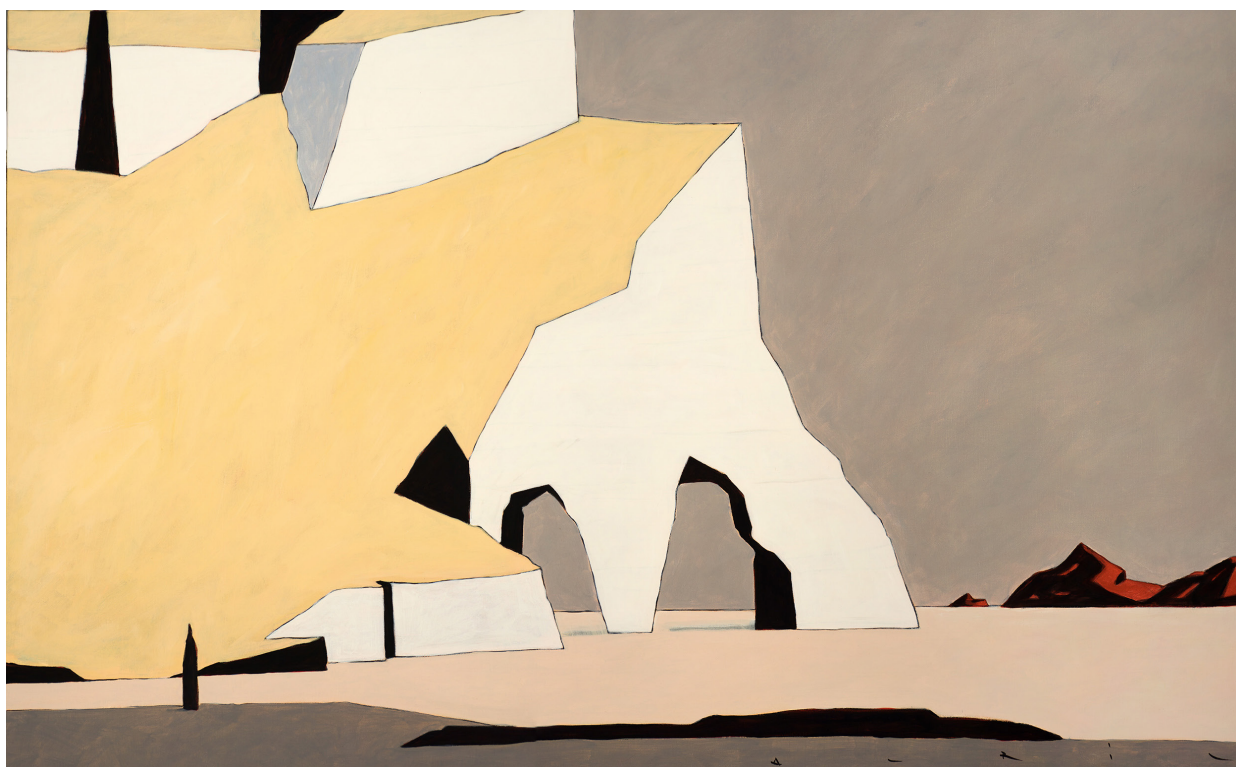
White Cliff V, 2020 Acrylique sur toile, 81 x 130 cm

Puisant son inspiration dans l'observation des villes et des paysages, François Avril livre à travers ses œuvres une vision poétique et renouvelée de la réalité. L'esthétique graphique et la rigueur de ses compositions ont fait de lui un artiste à l'identité remarquable. En dessin comme en peinture, les villes demeurent l'un de ses sujets de prédilection. Plus qu'une destination c'est l'idée d'une ville que François Avril aime raconter. Des jeux de construction, de perspectives et de lignes de fuite qu'il aime assembler. Adoptant le point de vue du promeneur solitaire, il recrée le décor d'une cité fantasmée où le temps et le bruit semblent s'arrêter. Une magie qu'il décline en différents lieux comme Tokyo, New-York ou Bruxelles. Finalement peu lui importe la destination, puisque celle qu'il représente n'existe pas.