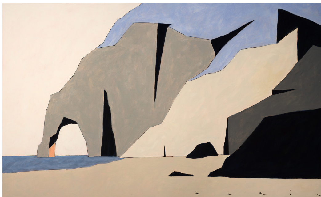
White Cliff IV, 2020 Acrylique sur toile, 81 x 130 cm

Paysage intérieur ou ville-âme ? L'univers d'Avril s'équilibre entre réalisme et abstraction, entre ligne et volume, entre monochrome et couleurs. Une harmonie graphique subtile aux frontières fragiles. « Qu'il s'agisse de ville ou de paysage, je pars toujours de quelque chose de réaliste que je recompose pour créer des utopies. J'observe et c'est la mémoire qui fait son travail de sélection. De retour à mon atelier, je ne dispose plus que d'un résidu de ce que j'ai vu. Je ne garde qu'une composition forte et les détails disparaissent. C'est pour toutes ces prises de liberté avec mon sujet, réaliste, qu'on peut penser que je suis à la limite de l'abstraction. » François Avril.