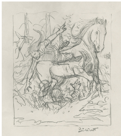
La fortune des Winczlav - Vanko 1848, Tome 1 - Sans titre 16, 2021 Mine de plomb sur papier, 15,2 x 13 cm

Huberty & Breyne exposera les planches du Tome 1 de cette saga fort attendue, du 25 mars au 24 avril 2021.