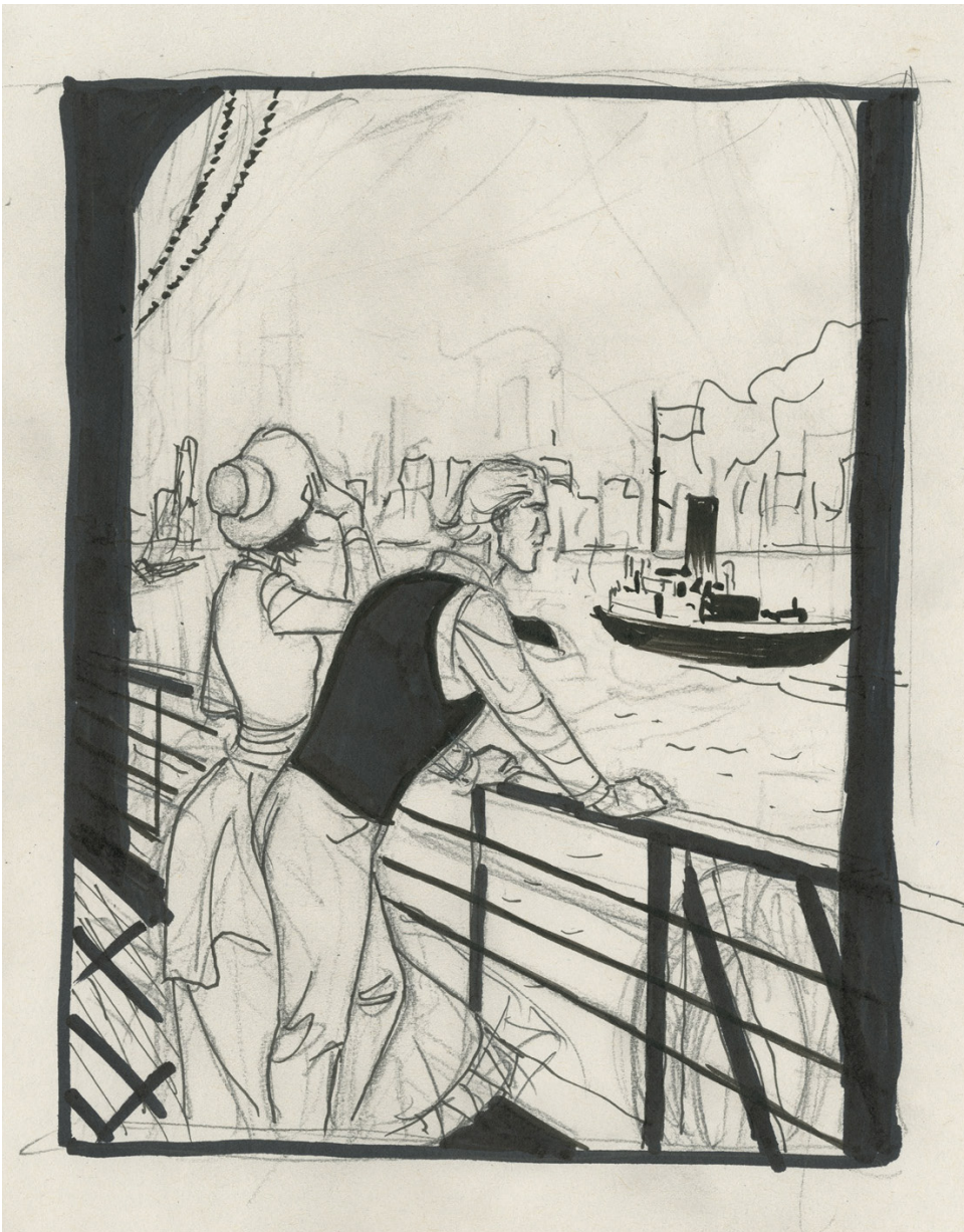
La fortune des Winczlav - Vanko 1848, Tome 1 - Couverture, 2021 Mine de plomb et encre de Chine sur papier, 17 x 29,5 cm