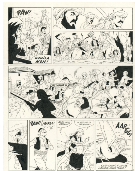
La fortune des Winczlaw - Vanko 1848, Tome 1 - Planche 3, 2021 Encre de chine sur papier, 42 x 32 cm