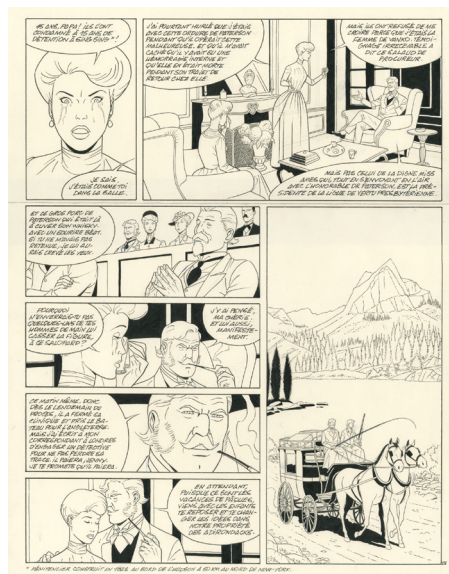
La fortune des Winczlaw - Vanko 1848, Tome 1 - Planche 23, 2021 Encre de chine sur papier, 42 x 32 cm

À partir de 1992, Van Hamme signe la saga brassicole Les Maîtres de l'orge sur un dessin de Francis Vallès (Glénat). La série, toujours sur scénario de Van Hamme, sera ensuite adaptée pour France 2. En 1996, Van Hamme crée à nouveau l'événement en « réanimant » les vénérables Blake et Mortimer dans l'album L'affaire Francis Blake (Dargaud), sur un dessin signé Ted Benoit.