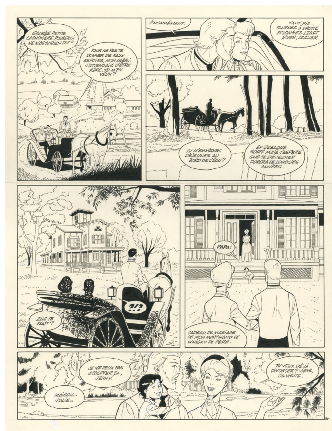
La fortune des Winczlaw - Vanko 1848, Tome 1 - Planche 20, 2021 Encre de chine sur papier, 42 x 32 cm

En 2021, Philippe Berthet fait son retour aux Éditions Dupuis pour une nouvelle série exceptionnelle : une trilogie intitulée La Fortune des Winczlaw , préquel des aventures de Largo Winch. Scénarisée par Jean Van Hamme, cette série permet à Berthet de conjuguer tous ses talents et centres d'intérêt, qu'il s'agisse du polar, de la reconstitution historique ou des grands espaces.