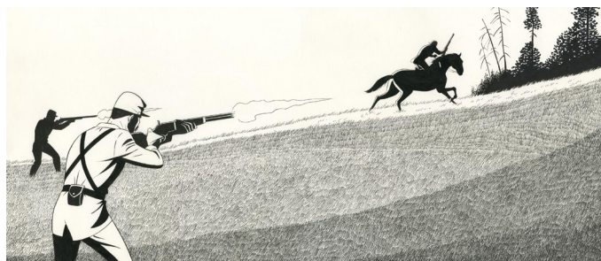
La fortune des Winczlav - Vanko, 1848, Tome 1 - Jaquette de couverture, 2021, Encre de chine sur papier, 32 x 74 cm