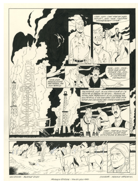
La fortune des Winczlaw - Vanko 1848, Tome 1 - Planche 54, Encre de chine sur papier, 42 x 32 cm