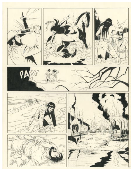
La fortune des Winczlaw - Vanko 1848, Tome 1 - Planche 43, 2021 Encre de chine sur papier, 42 x 32 cm