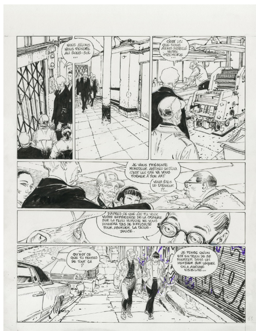
New York Cannibals, planche 67 Encre de Chine et de couleur sur papier, 59 x 48 cm