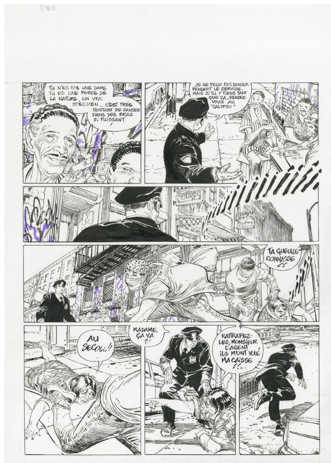
New York Cannibals, planche 15

À l'occasion de la sortie aux éditions du Lombard de New York Cannibals , signé François Boucq et Jérôme Charyn, la Galerie Huberty & Breyne est heureuse de dévoiler en avant-première dès le 4 septembre, une sélection des planches originales de François Boucq dans son espace parisien. Six ans après la conclusion sanglante de leur album précédent Little Tulip qui mettant en scène Pavel, un tatoueur New Yorkais d'origine russe ayant connu l'enfer des goulags sous Staline, le duo récidive avec un nouvel album noir et puissant sublimé par la virtuosité du dessin de François Boucq. Découvrir les planches originales réalisées aux encres de Chine noire, violette et rouge et admirer la virtuosité du geste d'un des plus grands artistes du neuvième art est un évènement.