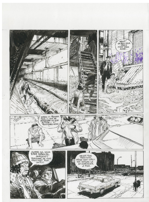
New York Cannibals, planche 110 Encre de Chine et de couleur sur papier, 59 x 48 cm

François Boucq (1955) naît, grandit et étudie à Lille. Peu intéressé par les études, il quitte le lycée après son bac en 1974 et se rend à Paris avec pour seule idée en tête celle de faire de sa passion qu'est le dessin son métier. Le jeune autodidacte toque alors aux portes des rédactions et décroche rapidement ses premières piges comme caricaturiste politique au Point, à L'Expansion, et au Matin de Paris avant de s'embarquer dans l'aventure de la bande dessinée. En 1978, paraissent ses premiers Cornets d'Humour dans la revue Pilote . En 1980, Fluide Glacial accueille Les Leçons du Professeur Bourremou (avec Pierre Christin). Mais c'est la publication, en 1984, de Pionniers de l'Aventure Humaine , dans la revue (A Suivre) puis l'édition de La Femme du Magicien ou Bouche du Diable (en association avec l'écrivain américain Jérôme Charyn) qui le révèlent au grand public.