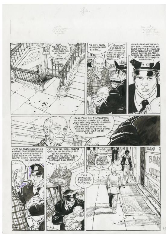
New York Cannibals, planche 20

1 : Entretien dans actuaBD – Janvier 2015