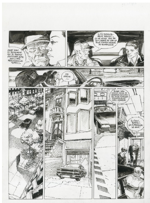
New York Cannibals, planche 112

Encre de Chine et de couleur sur papier, 59 x 48 cm