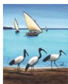
Les ibis , cover de "la ligne de front", de J. Rolin, ed. La table ronde La croisière du snark de J. London, ed. La table ronde