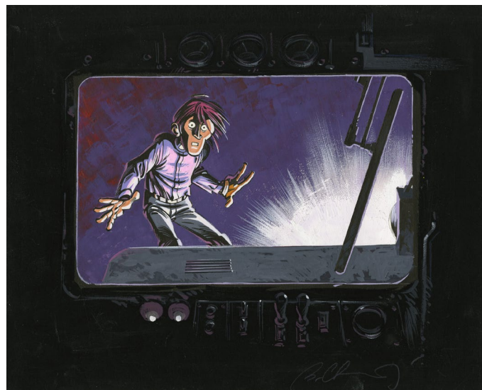
Soda - Dessin, 22 x 29 cm

La galerie Huberty & Breyne dévoile pour la première fois à Paris une sélection des plus belles planches originales des albums réalisés par Bruno Gazzotti entre 1991 et 2005 ainsi qu'un ensemble inédit d'illustrations couleur mettant en scène le lieutenant Soda.