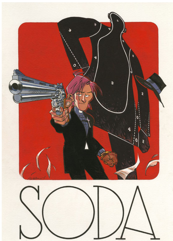
Soda - Cible, Dessin, 26 x 23 cm

Son dessin grand public est d'une délicieuse lisibilité. Mais Bruno Gazzotti possède en plus un don unique pour le découpage, conférant à son trait un incroyable impact cinématographique. Bâisseur graphique du succès de Soda le célèbre flic-pasteur new-yorkais créé par Tome ( Le petit Spirou ), « Gazzo » est aussi le dessinateur de Seuls , série multi-récompensée et scénarisée par Fabien Vehlmann. Deux best-sellers faisant de Bruno Gazzotti un auteur devenu incontournable, malgré sa proverbiale simplicité.