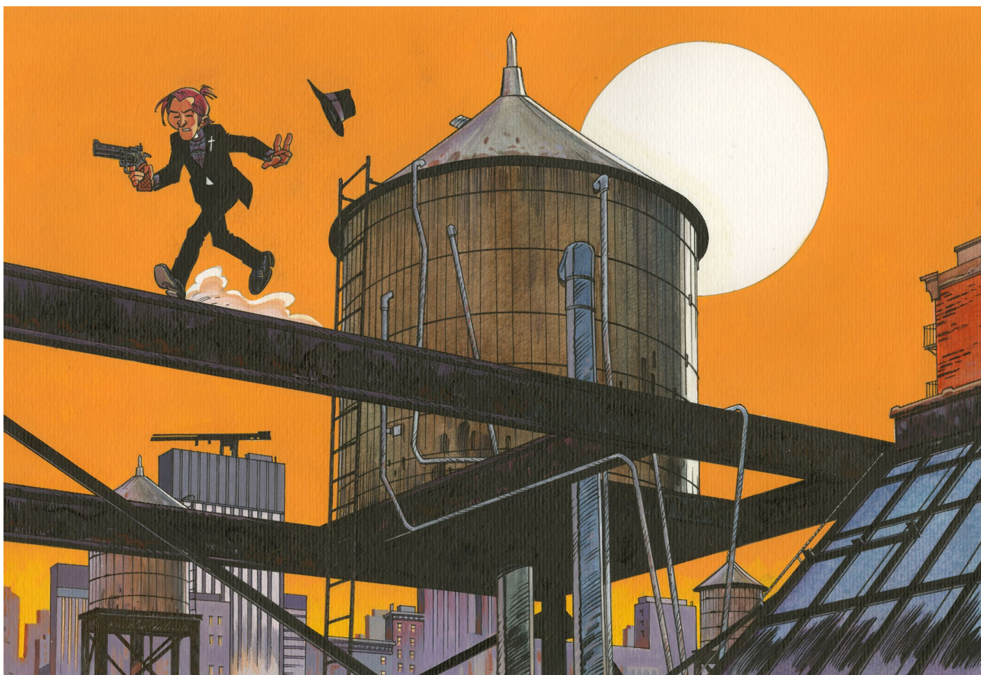
Soda - Tank, Dessin, 26,5 x 39,5 cm