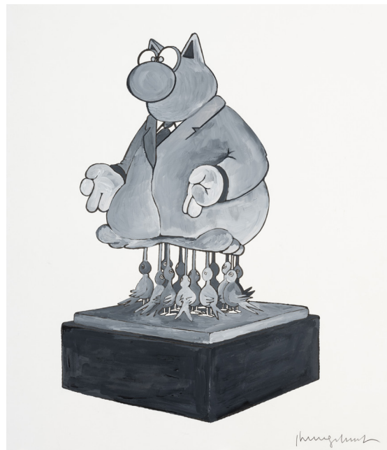
Rawhajpoutacha - Acrylique sur carton, 50 x 60 cm