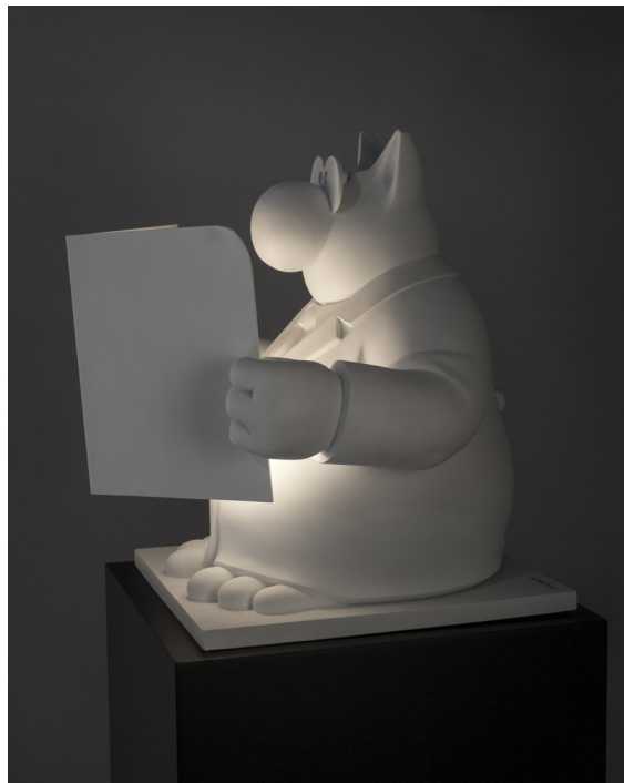
Chat lampe - Tout s'éclaire, résine peinte et éclairage led

L'exposition permettra également de découvrir des toiles et dessins de grand format, ainsi que des œuvres multiples en hommage aux grands noms de l'histoire de l'art.