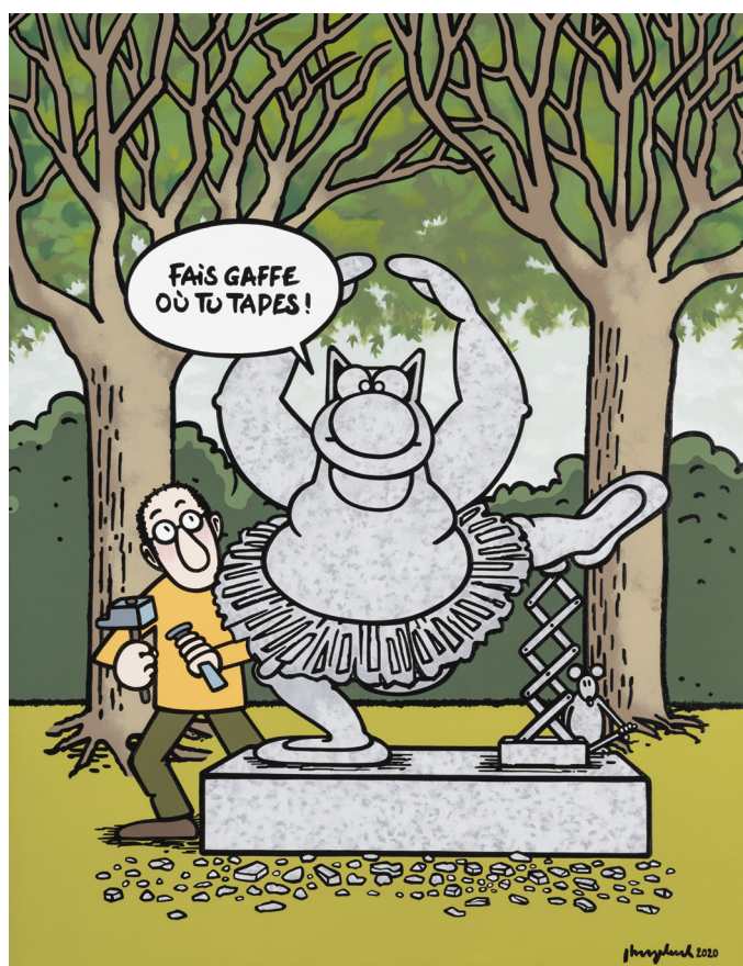
Fais gaffe où tu tapes - Acrylique sur toile, 146 x 114 cm

Reportées suite au confinement, l'inauguration de l'exposition à la galerie Huberty & Breyne et l'installation sur les Champs-Élysées se dérouleront en concomitance, le jeudi 25 mars et le vendredi 26 mars en présence de Philippe Geluck.