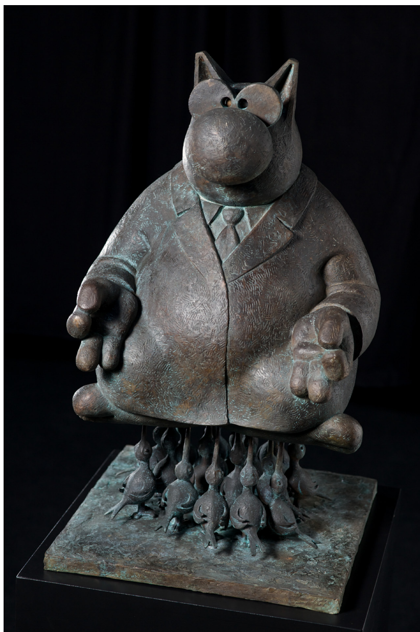
Rawhajpoutacha, bronze à cire perdue, 72 x 42 x 42 cm