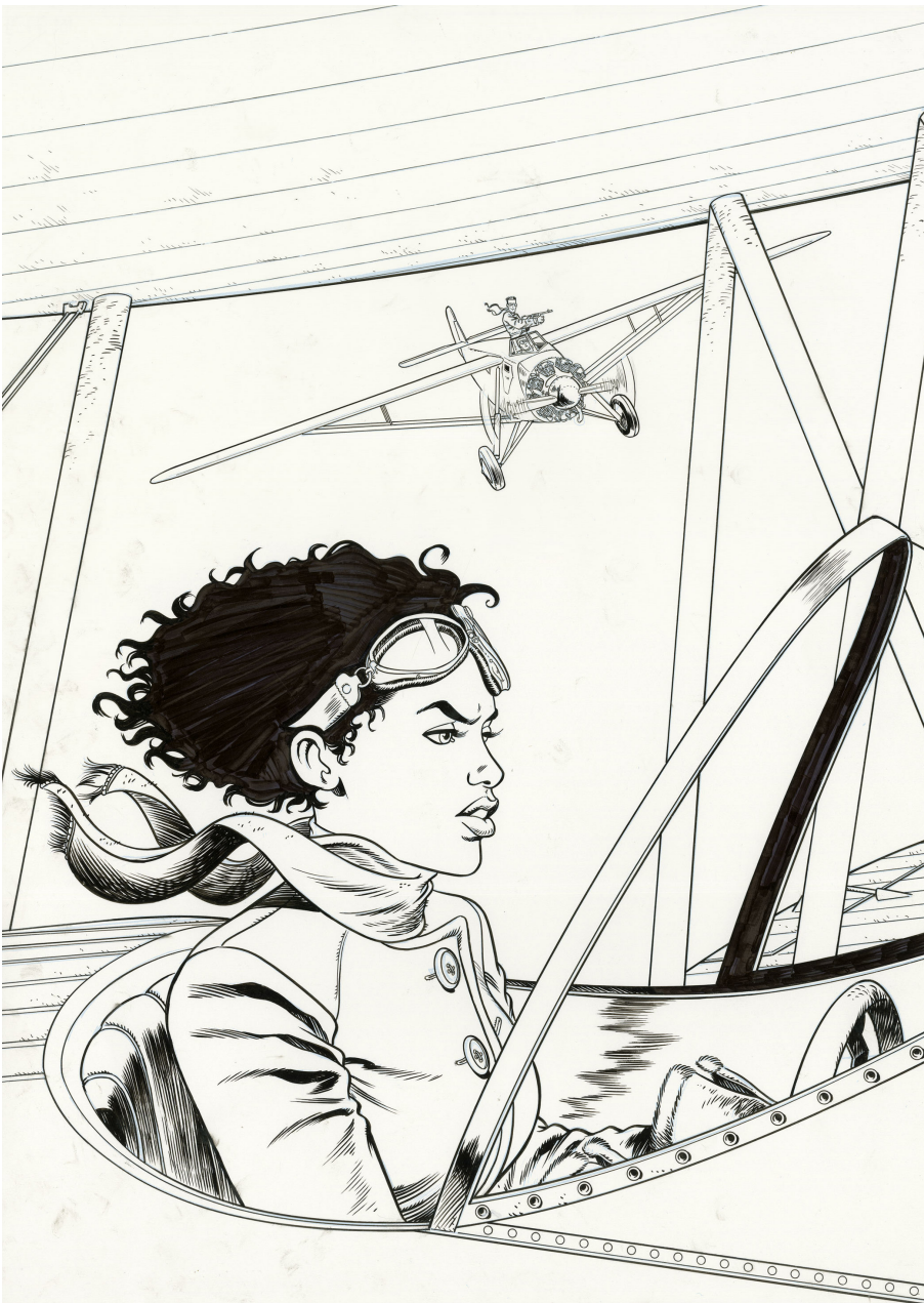
Black Squaw Couverture Spirou n°4330 Encre de Chine sur papier, 50 x 36,5 cm