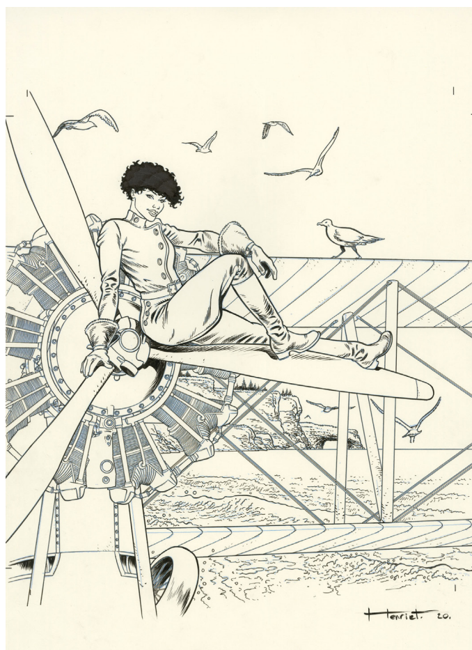
Black Squaw - Calendrier Spirou - mois de juin Encre de Chine sur papier, 32 x 29,6 cm