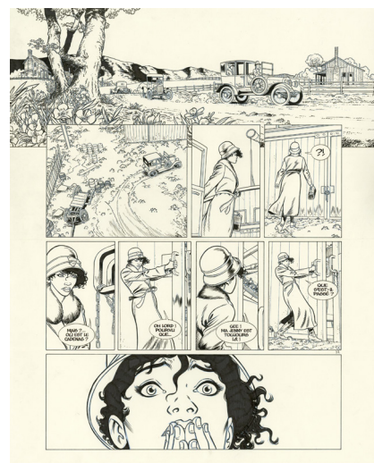
Black Squaw - Scarface Tome 2, Planche 37 Encre de Chine sur papier, 49 x 41,4 cm

Vivant mille et unes vies à travers ses personnages de papier, Yann emporte ses lecteurs dans des aventures tour à tour drôles, épiques, féroces, cyniques, humanistes ou le tout à la fois. Depuis ses mythiques Hauts de pages chez Spirou , jusqu'à Dent d'ours et Black Squaw , en passant par Le groom vert-de-gris et Gringos locos , il est un auteur attachant et incontournable, dont la qualité des bons mots n'a d'égale que son érudition.