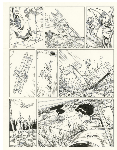
Black Squaw - Night Hawk Tome 1, Planche 41 Encre de Chine sur papier, 44 x 32,5 cm

Aussi méticuleux qu'un graveur lorsqu'il s'agit de dessiner un avion d'époque, Alain Henriet est pourtant capable de l'animer avec un sens du mouvement qu'il partage avec les meilleurs cinéastes contemporains. Auteur incontournable du catalogue Dupuis, Alain Henriet donne ses lettres de noblesse actuelles à la grande tradition de la Bande Dessinée réaliste tous publics.