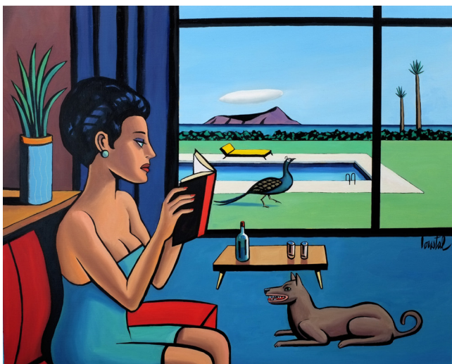
Un livre remarquable, 2021 Huile sur toile, 81 x 100 cm