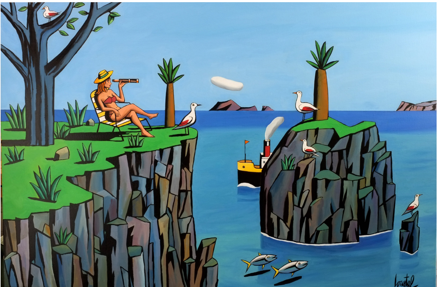
Watching the birds, 2021 Huile sur toile, 97 x 146 cm