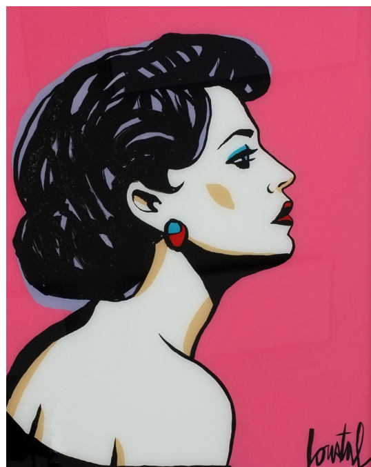
Portrait 3, 2021 Fixé sous-verre, 50 x 40 cm