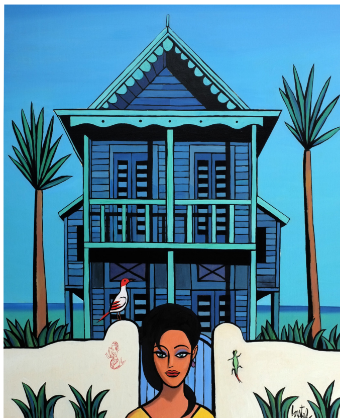
Rue des sables, 2021 Huile sur toile, 100 x 81 cm

Les thèmes que je choisis alternent entre grands paysages, nus et quelques scènes d'intérieur. Mais il s'agit toujours de compositions très épurées. On retrouve des éléments récurrents dans mes images. Je ne dessine que des choses qui m'attirent. Je suis fasciné par le monde animal... les chiens, les oiseaux, les poissons... Dès que je suis au bord de la mer, je vais voir les pêcheurs, les marchés, je regarde toutes ces formes incroyables qu'on tire du fond de la mer.