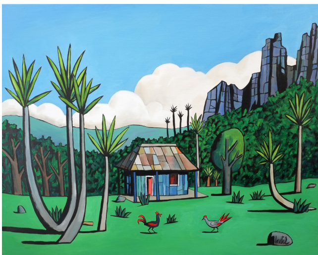
Un faré à Moorea, 2021 Huile sur toile, 73 x 92 cm