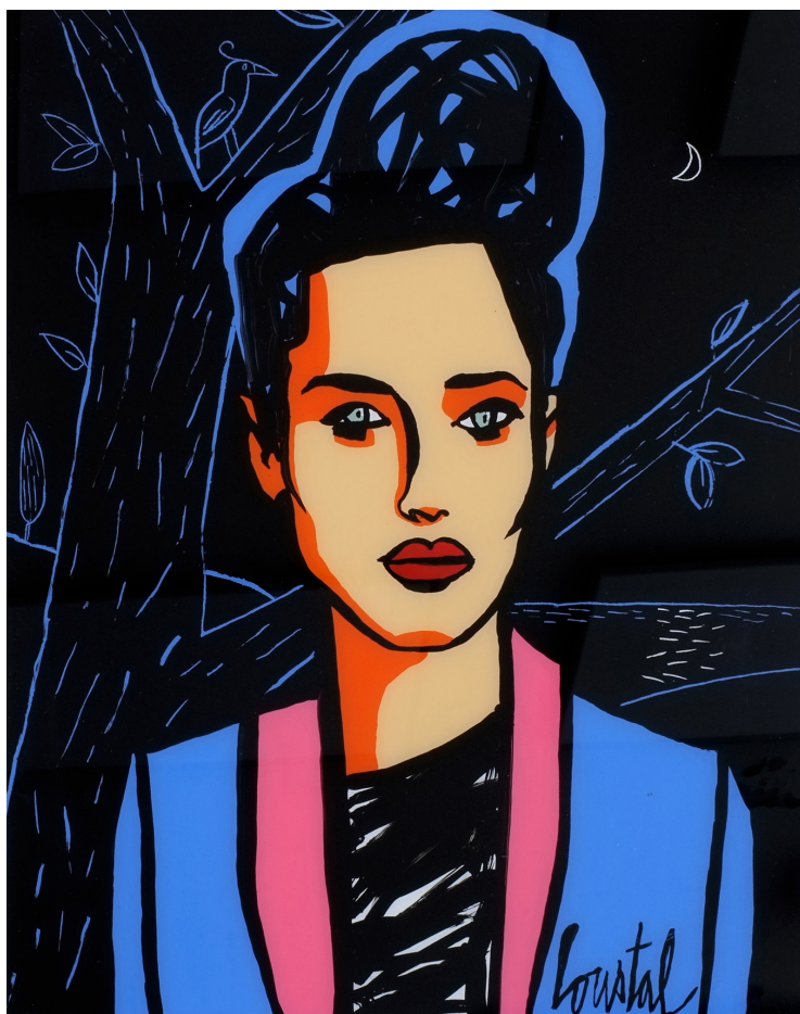
Portrait 4, 2021 Fixé sous-verre, 50 x 40 cm

Du 9 décembre 2021 au 8 janvier 2022, elle rassemble dans l'espace de l'avenue Matignon les dernières toiles et les fixés sous verre inédits de Loustal. Entre réel et imaginaire, ses œuvres aux ambiances voyageuses sont une invitation au rêve. Intérieurs typés, extérieurs lumineux, portraits sensibles ou scènes de genre, l'artiste déploie la palette de son immense talent, avec la subtilité qu'on lui connaît dans le traitement des couleurs. Le rythme contemplatif des scènes immobiles, les cadrages cinématographiques, les cernés noirs des figures et l'ambiance solaire caractérisent chacune des peintures exposées.