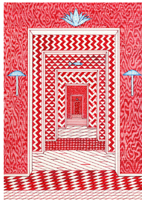
Red Rooms - Red Lines (2021) Stylo bille sur papier, 29,7 x 21 cm