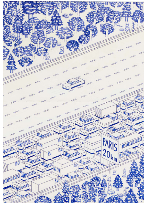
L'échappée - Blue Lines (2014) Stylo bille sur papier, 42 x 29,7 cm Collection SOCIÉTÉ BIC