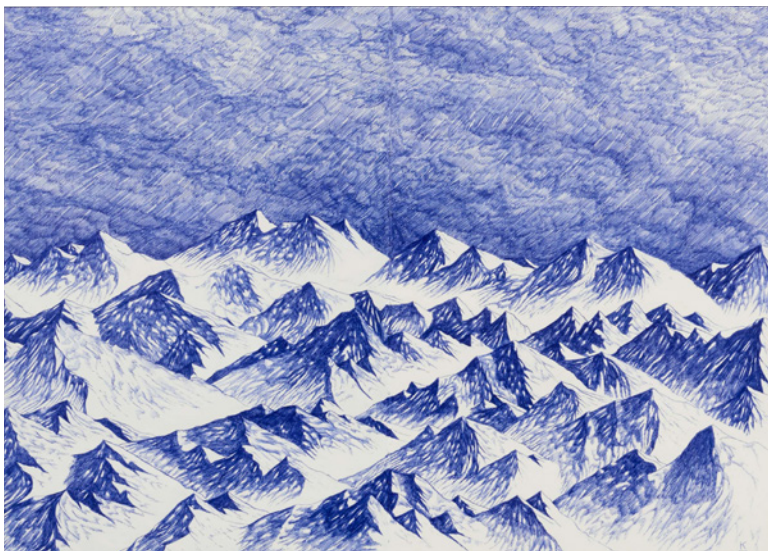
Cîmes - Blue Lines (2015) Stylo bille sur papier, 29,7 x 42 cm Collection SOCIÉTÉ BIC