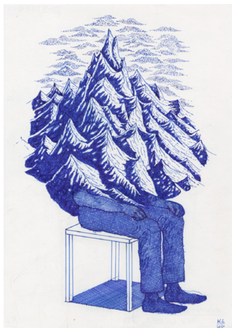
Méditation 4 - Blues Lines (2020) Stylo bille sur papier, 26,9 x 17,3 cm