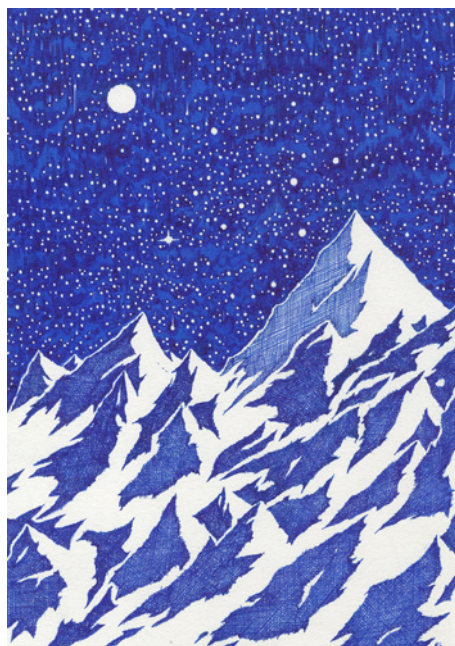
Heights - Blue Lines (2020) Stylo bille sur papier, 29,7 x 21 cm