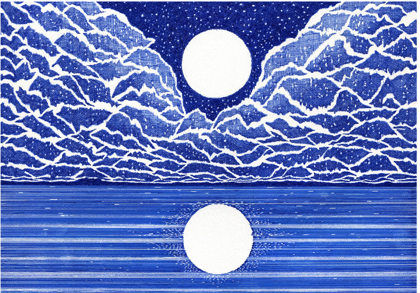
Twin Moons - Blue Lines (2020) Stylo bille sur papier, 30 x 42 cm