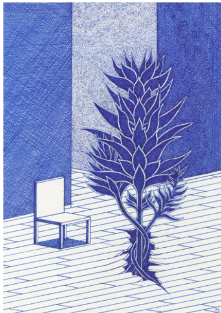
Germination - Blue Lines (2020) Stylo bille sur papier, 29,7 x 21 cm

« Des lignes bleues et rouges », titre l'exposition avec modestie. Réponse joyeuse aux toiles de Barnett Newman (Who's Afraid of Red, Yellow and Blue) ? Allusion malicieuse à l'art minimal et conceptuel ? Le travail de Lucbert suggère que la forme simple, en art, n'a pas dit son dernier mot, et qu'un trait, s'il est nouveau, peut modifier notre regard et l'univers. « Less is more », affirmait déjà Ludwig Mies van der Rohe – ce texte même apparaît soudain inutile face à l'efficacité de ces trois mots devant l'œuvre de Lucbert.