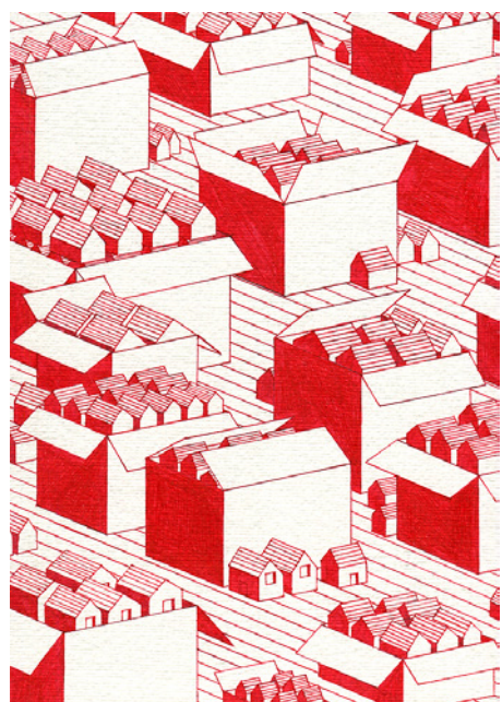
The Collector - Red Lines (2021) Stylo bille sur papier, 29,7 x 21 cm