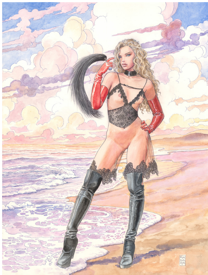
Vogue Italy - (Dress: Gucci, Model: Olivia Vinton), 2020 Couverture- Aquarelle sur papier

Une seconde série de dessins, tous publiés sur le Facebook de l'artiste seront présentés au public lors de cette exposition. Le connaisseur aura également le plaisir de retrouver quelques œuvres plus anciennes comme des illustrations du très réputé Parfum de l'invisible , paru en 1986 et 1995.