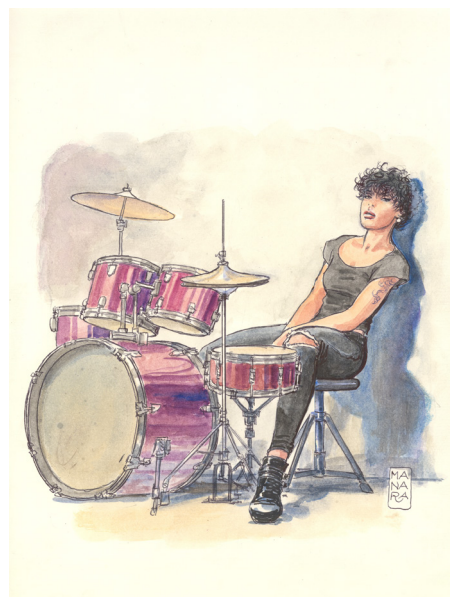
Culture à l'arrêt - La batteuse, 2020 Aquarelle sur papier