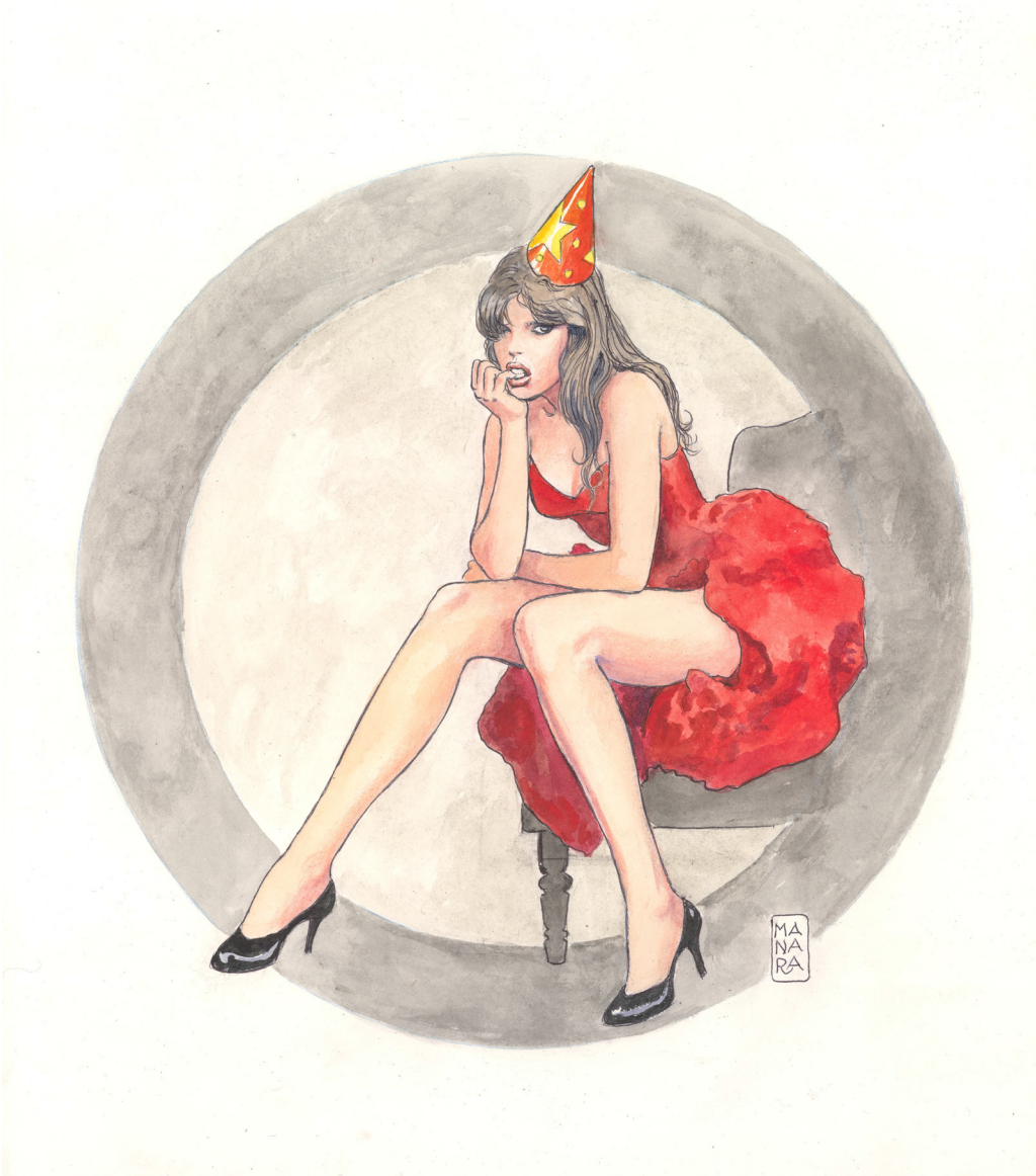
Party at Home (Capodanno 2021), 2020 Aquarelle sur papier