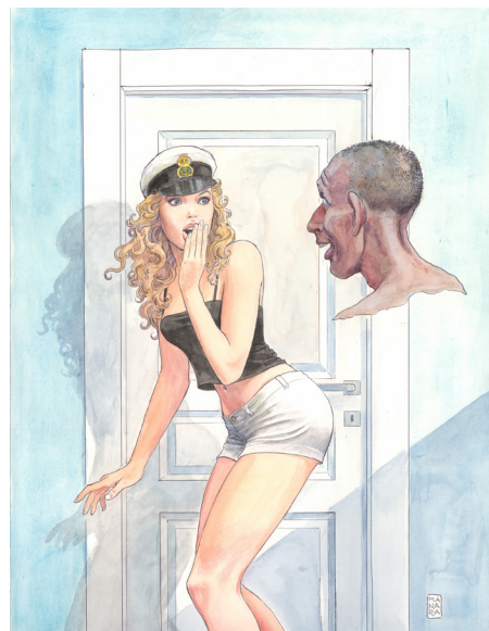
Le Parfum de l'invisible, 2020 Couverture - Aquarelle sur papier

« Cette série d'aquarelles comprend vingt-cinq dessins, ce sont des pensées. Elles disent : « Je pense à vous et je vous dis merci. » Nous mettons un nouveau dessin en ligne sur les réseaux sociaux tous les deux jours. J'ai très vite commencé à recevoir des messages du monde entier pour me remercier. Des médecins, des infirmières... »