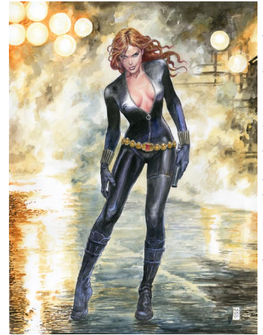
Couverture alternative Black Widow © Manara/Marvel

Tandis que le Musée ArtLudique consacre jusqu'à la fin de l'été ses cimaises aux Super Héros et que les X-Men débarquent en salle, les héroïnes «marvelienne» Gamora, Scarlett Witch, Shana, Valkiria, Storm ou encore Blackwidow seront à l'affiche de la rétrospective de la Galerie Huberty-Breyne. A découvrir, 10 aquarelles des grands formats ayant servi pour les couvertures alternatives de l'univers Marvel.