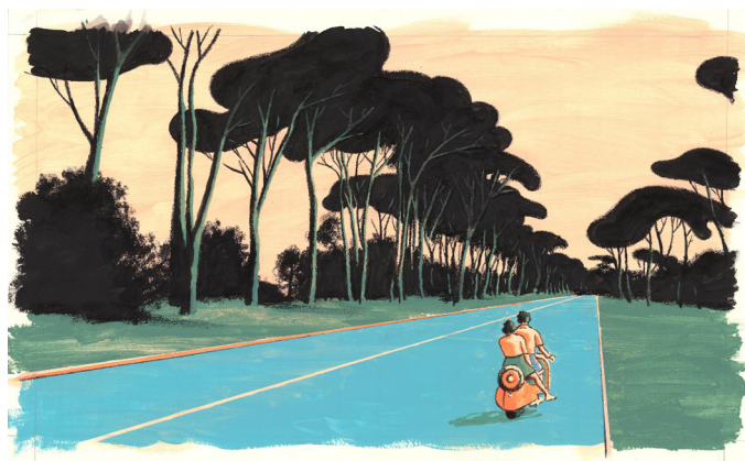
Sans titre, 2, 2021 Technique mixte sur papier, 39,5 x 65 cm

Les lecteurs ont aujourd'hui la chance de découvrir Amore , paru aux Éditions Delcourt, ouvrage composé de multiples petites histoires d'amour au cœur de l'Italie des années cinquante.