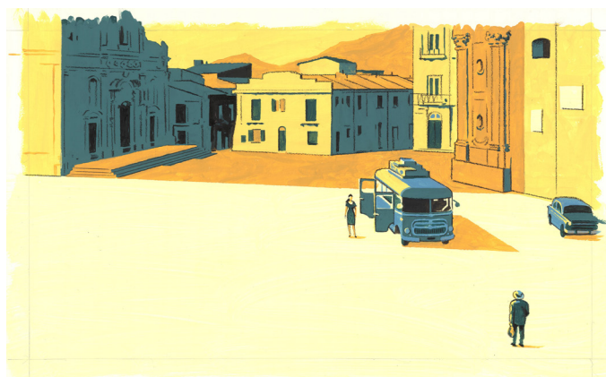
Sans titre, 3, 2021 Technique mixte sur papier, 40 x 64,9 cm

Éditeur : Delcourt Collection : Mirages Parution : 22/09/21 Scénario : Zidrou Dessin : David Merveille Format : 20 cm x 26,5 cm Pagination : 128 pages EAN : 9782413011224