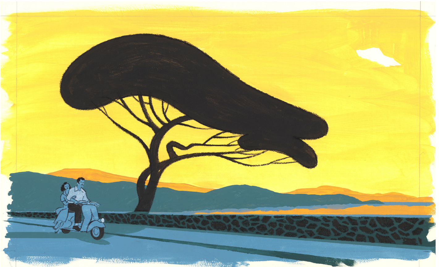
Sans titre, 1, 2021 Technique mixte sur papier, 39 x 64,9 cm