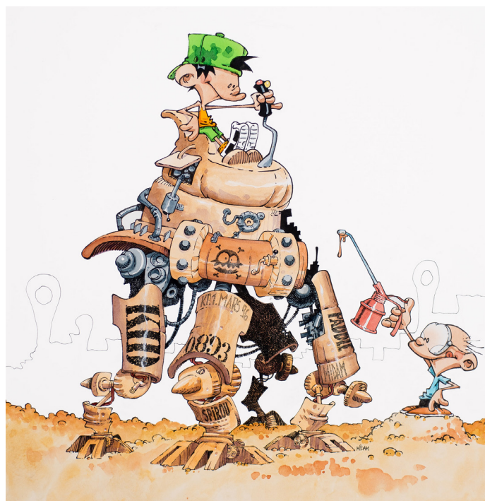
Couverture Spirou 4308 Encres de couleur sur papier, 61 x 53,5 cm

L'ouvrage intitulé Midam, un parcours d'artiste , publié aux éditions Bern'Art, accompagne cette exposition alors que Tattoo compris , le tome 17 de Kid Paddle , est attendu en librairie le 29 octobre prochain (éditions Dupuis).