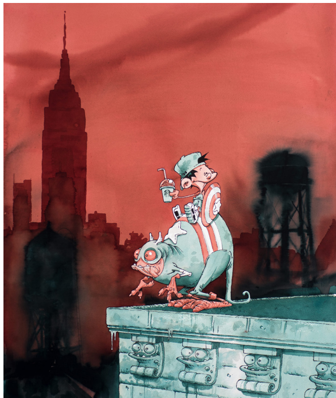
Kid et Captain America Encres de couleur sur papier, 106 x 76 cm

En près de 30 ans, Kid Paddle est devenu l'un des univers les plus populaires de la Bande Dessinée actuelle avec plus de 10 millions d'albums vendus, l'adaptation en 104 épisodes d'animation diffusés dans plus de 20 pays et la série spin off, Game Over , créée en 2004 et devenue aussi culte que l'originale.