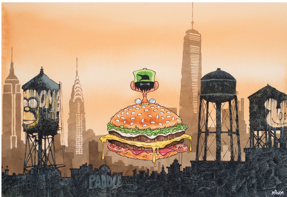
Hamburger Kid-NY Encres de couleur sur papier, 51 x 74 cm