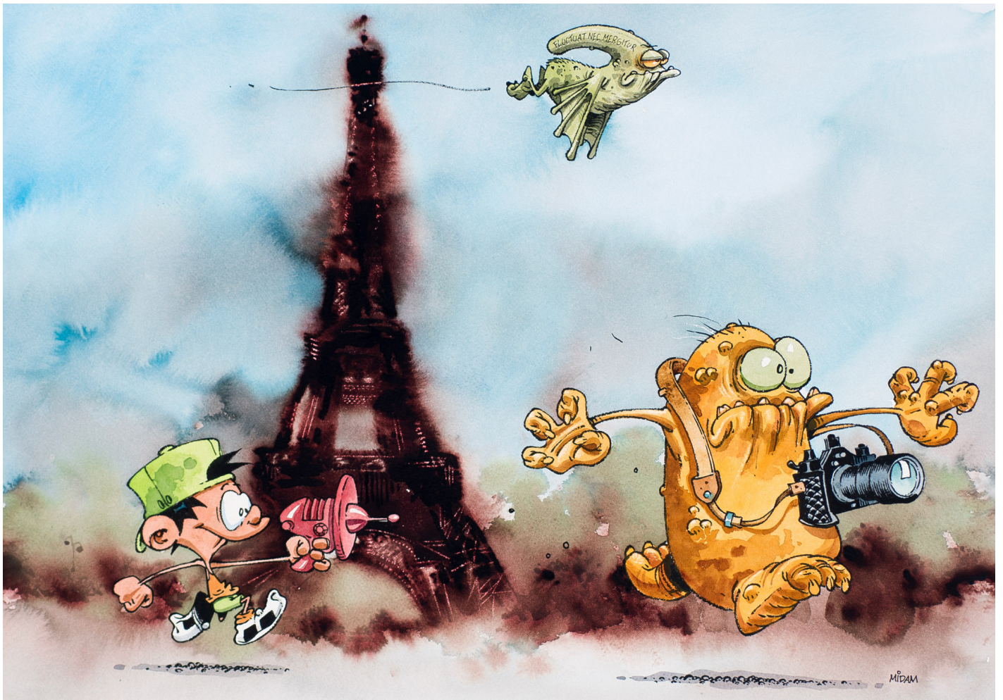
Fluctuat nec mergitur Paris Encres de couleur sur papier, 40 x 57,7 cm