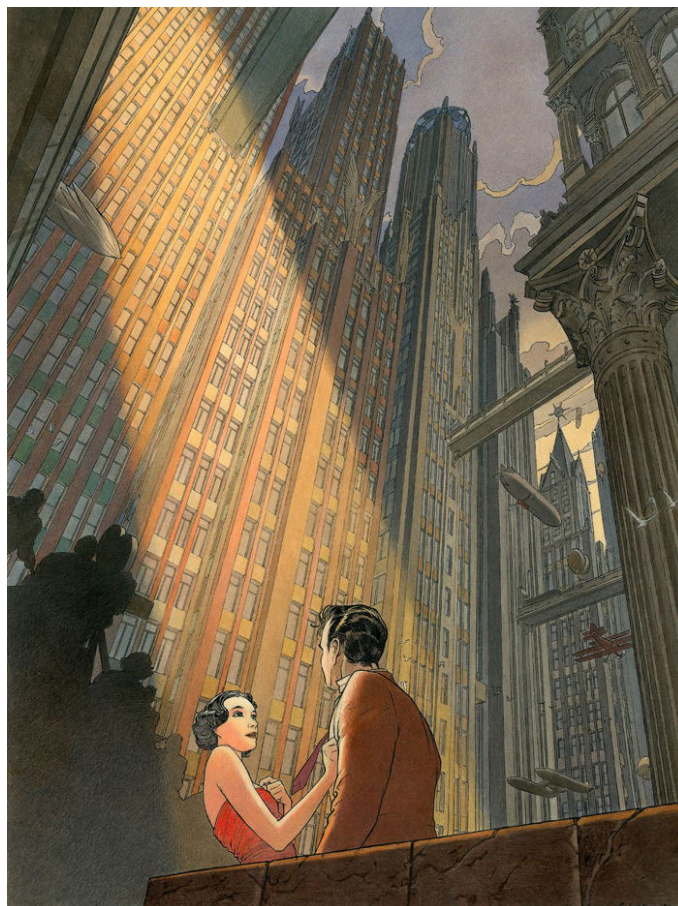
François Schuiten, Le dernier plan, 1989 Technique mixte sur papier, 55 x 40 cm

Enfin, citons encore deux peintures réalisées par deux grands maîtres du Neuvième art : un grand décor de western mettant en scène des cavaliers surgissant en tirant dans un canyon tortueux, le tout peint en 1997 par Jean Giraud au sein de l'univers de son fameux héros Blueberry ; et de l'autre, « Le Dernier plan », une magnifique réalisation de François Schuiten en 1988 tout en perspective et en hommage au cinéma pour l'exposition Cité Ciné de Gand dans l'univers de ses Cités obscures .