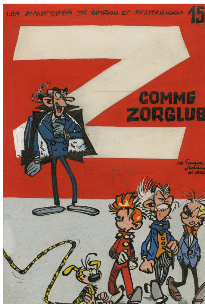
André Franquin, Z comme Zorclub - Spirou et Fantasio

Une occasion unique de découvrir couvertures, planches et illustrations qui ont marqué et marquent encore l'Histoire du Neuvième art.