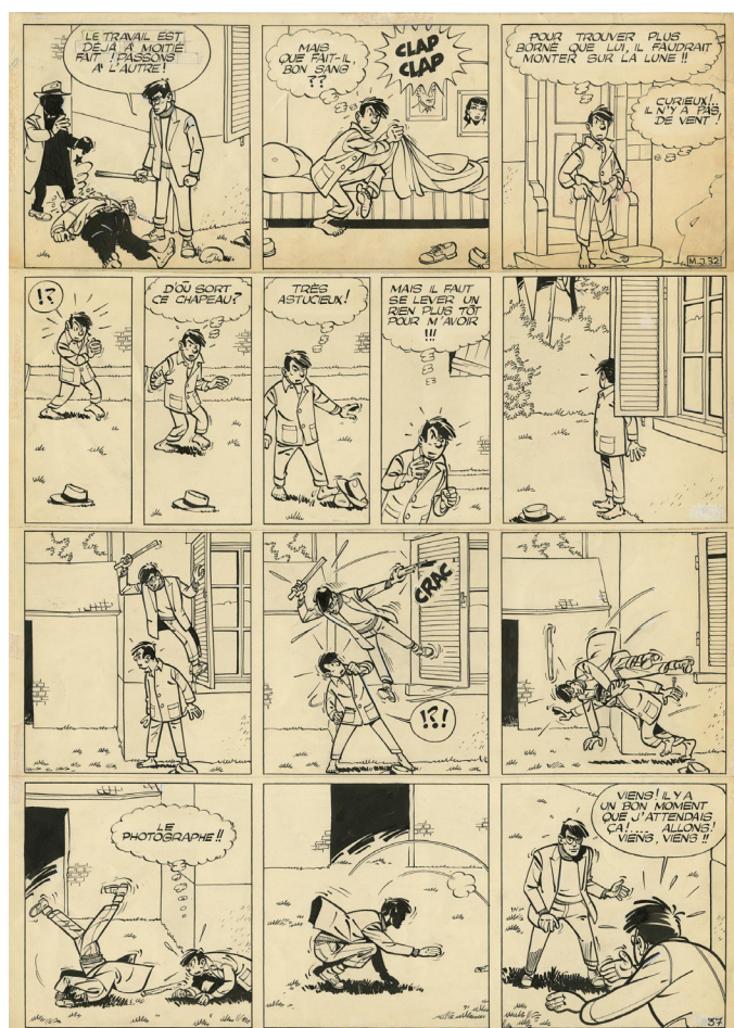
Maurice Tillieux, Le lac de l'homme mort - Marc Jaguar, Planche 37, 1957

Dernier pan de cette exposition, les peintures, affiches et illustrations réalisées par les auteurs en dehors de leur albums traditionnels. Ces échappatoires permettaient aux artistes de donner libre cours à leurs talents et leurs fantaisie sans devoir suivre le canevas d'un récit proprement dit. Citons ainsi cette remarquable affiche publicitaire réalisée par Moebius pour les chaussures Eram, et qui est enrichi d'une magnifique citation au crayon du poétique auteur ; cette Schtroumpfette transformée en