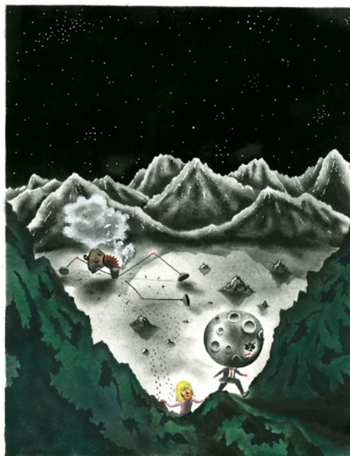
Le Roi de la lune , 2019 Encre sur papier, 29,5 x 23 cm © Donatien Mary, Éditions 2024