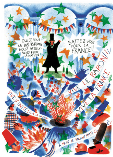
Le premier bal d'Emma , 2008/2010 Encre sur papier, 26,5 x 19 cm © Donatien Mary, Éditions 2024

Donatien Mary jongle entre dessin, graphite, gouache, encres ou monotypes. Il joue avec les codes de la bande dessinée : bulles, onomatopées et cases qu'il va jusqu'à faire voler en éclats... tout est permis dans cet art de faire bouger les images. Il l'a bien compris en s'autorisant à suivre les méandres de son flot de conscience graphique et narratif. Tout oser, tant sur le fond que sur la forme, en veillant à laisser assez de place au pouvoir d'imagination du lecteur pour se déployer.