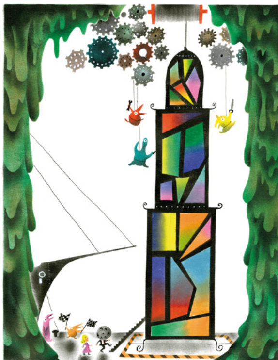
Le Roi de la Lune , 2019 Encre sur papier, 29,5 x 23 cm © Donatien Mary, Éditions 2024

Pour On verra bien , sa première exposition, Mycélium a choisi de se focaliser sur ses « écritures en couleur ». Dessins uniques, séries d'illustrations ou planches de bande dessinée, quel que soit le temps de la narration, la couleur cadence notre regard, le suspend ou le propulse. Donatien Mary est un vrai chorégraphe qui fait valser de concert le mot et l'image pour nous pousser plus loin dans ses univers fantasmagoriques.