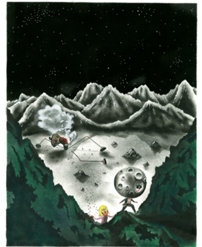
Le Roi de la Lune , 2019 Encre sur papier, 29,5 x 23 cm © Donatien Mary, Éditions 2024

Pour On verra bien , sa première exposition, Mycélium a choisi de se focaliser sur ses « écritures en couleur ». Dessins uniques, séries d'illustrations ou planches de bande dessinée, quel que soit le temps de la narration, la couleur cadence notre regard, le suspend ou le propulse. Donatien Mary est un vrai chorégraphe qui fait valser de concert le mot et l'image pour nous pousser plus loin dans ses univers fantasmagoriques.