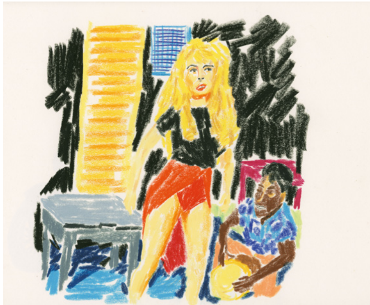
Et dieu... créa la femme, Roger Vadim, 2020-2023 Page 44 - Pastel gras sur papier 17,5 x 16,5 cm