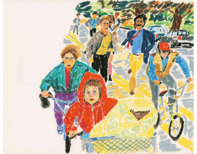
E.T. The Extraterrestrial , Steven Spielberg, 2020-2023 Page 54 - Pastel gras sur papier 20,5 x 21,5 cm