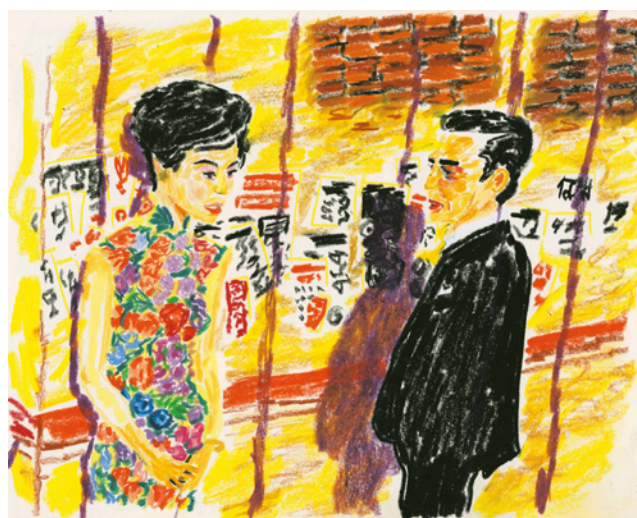
In the mood for love , Wong Kar-wai, 2020-2023 Page 20 - Pastel gras sur papier 20,5 x 26,5 cm