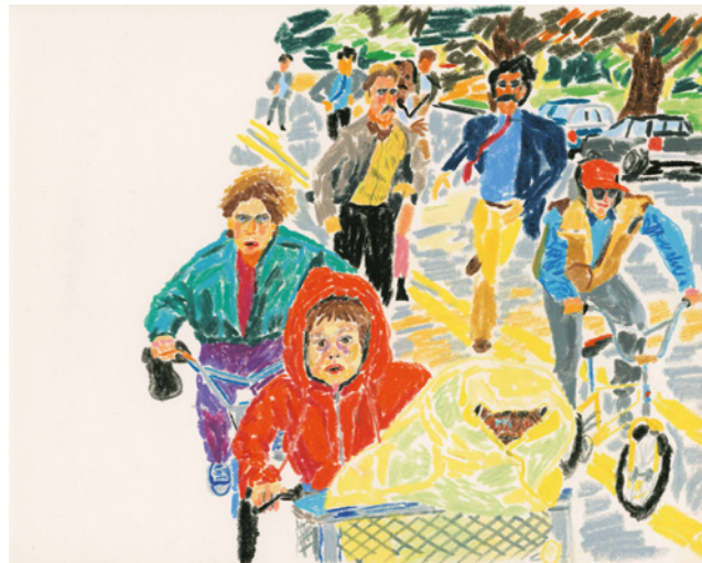
E.T. The Extraterrestrial , Steven Spielberg, 2020-2023 Page 54 - Pastel gras sur papier 20,5 x 21,5 cm