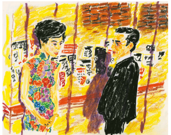
In the mood for love , Wong Kar-wai, 2020-2023 Page 20 - Pastel gras sur papier 20,5 x 26,5 cm