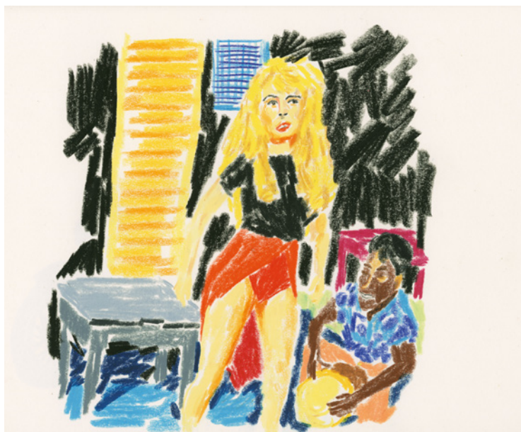
Et dieu... créa la femme, Roger Vadim, 2020-2023 Page 44 - Pastel gras sur papier 17,5 x 16,5 cm