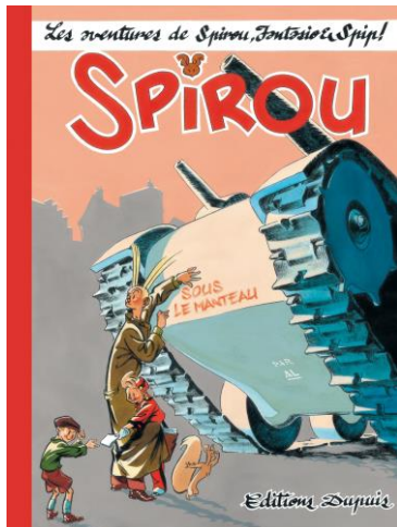
Couverture du mystérieux « Spirou sous le manteau » à paraître en septembre 2013

Interdit de publication par les Allemands en 1943, Le Journal de Spirou continua pourtant d'être produit et distribué clandestinement dans les rues de Bruxelles. Se résumant à une page pliée mettant en scène Spirou, Fantasio et Spip, le "journal" était signé par le dessinateur AL, un émule de Gus Bofa et de Jijé. Se procurer alors ce Journal de Spirou distribué sous le manteau s'apparentait à une véritable chasse au trésor : sur chaque dessin étaient imprimés, codés, la date et le lieu de distribution du numéro suivant.