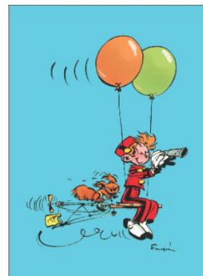
Illustrations réalisées par Franquin pour animer le journal des années 50 jusqu'au début 1970 et recolorisée par Fred Jannin

En janvier 2006, les Editions Dupuis lancent une série parallèle intitulée « Le Spirou de... ». Des auteurs s'emparent des personnages le temps d'une aventure pour en livrer une vision très personnelle. Frank Le Gall, Emile Bravo, Fabrice Tarrin,