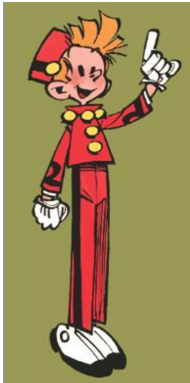
Illustrations réalisées par Franquin pour animer le journal des années 50 jusqu'au début 1970 et recolorisée par Fred Jannin