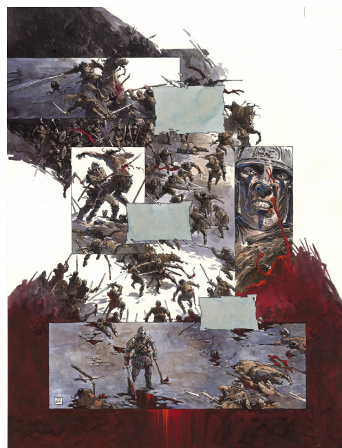
Macbeth Roi d'Écosse Seconde partie : Le livre des fantômes, Planche 22, 2021 Technique mixte sur papier, 62,3 x 47,4 cm