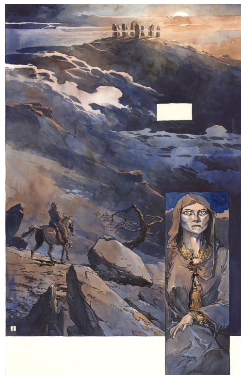
Macbeth Roi d'Écosse Seconde partie : Le livre des fantômes, Planche 1, 2021 Technique mixte sur papier, 56,3 x 36 cm