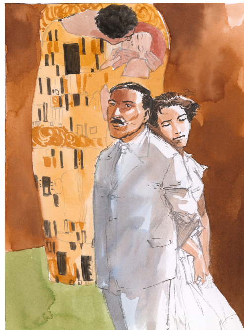
Les derniers jours de Stefan Zweig , Projet de couverture, 9, 2012 Aquarelle, encre de Chine et mine de plomb sur papier, 20,5 x 14,9 cm

2000, premier album solo, Mother , une réinterprétation du mythe du vampire où l'auteur règle quelques-uns de ses "petits problèmes personnels".