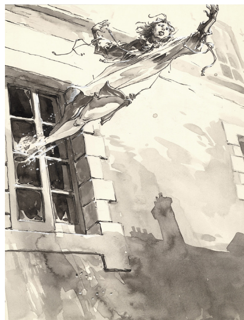
Hôtel Particulier Projet de couverture, 1, 2013 Technique mixte sur papier, 24,1 x 18,2 cm

Les travaux les plus récents de Sorel sont également présentés, comme les planches de Macbeth , Roi d'Écosse , le livre des fantômes (Éditions Glénat – Septembre 2021), second volume du diptyque, librement adapté de la pièce de William Shakespeare.