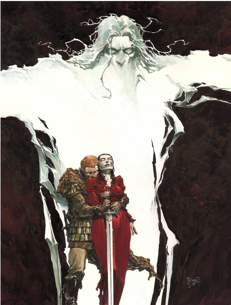
Macbeth Roi d'Écosse Seconde partie : Le livre des fantômes , Couverture de l'album, 2019 Technique mixte sur papier, 61,8 x 47,1 cm