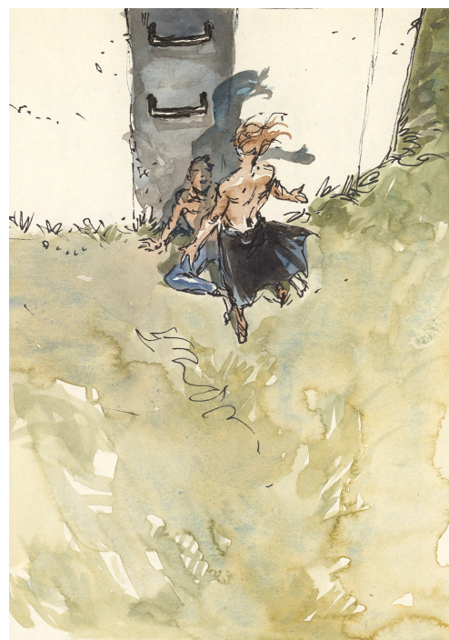
L'amer , Mâle de mer - Projet de portfolio, 2009 Feutre sur papier, 26,5 x 14,3 cm