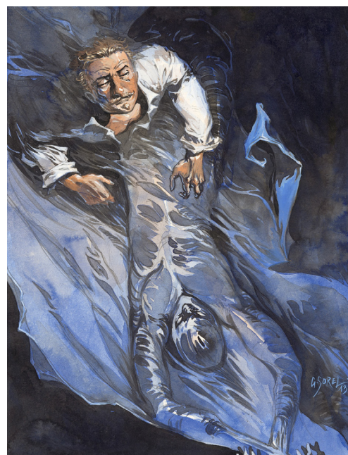
Le Horla , 2013 Encre de Chine et aquarelle sur papier, 24 x 18 cm