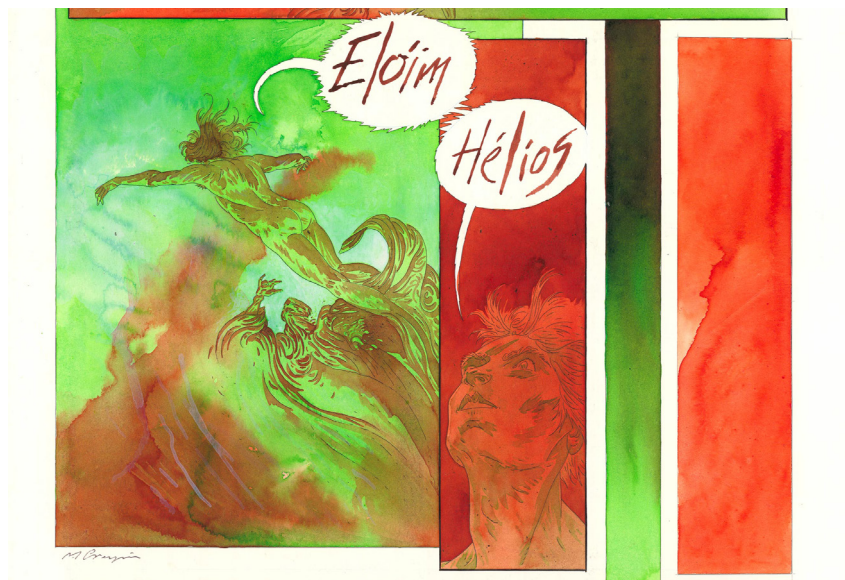
Faust d'heidelberg - L'étudiant - Tome 2 (détail)