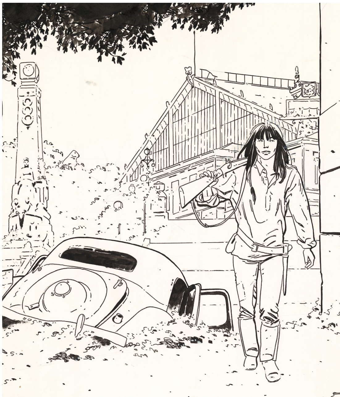
Marseille - Armalite - 16 - Tome 0 (détail)