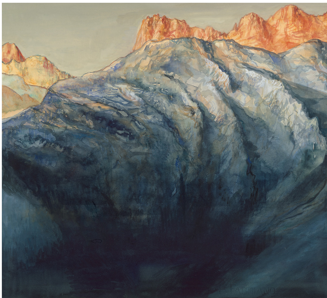
Nicolas de CRÉCY - Combe noire - 52 x 47 cm - Aquarelle sur papier - 2023

S'inspirant de sa propre expérience de la montagne, il retranscrit cette atmosphère particulière à travers près de septante œuvres aux techniques variées: peinture, collage, gravure, fusain, aquarelle, etc.