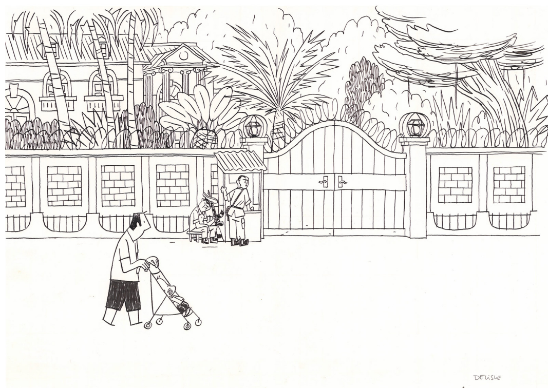
Guy DELISLE - Chroniques birmanes - Couverture de l'album - 2007 - Encre de Chine sur papier - 25 x 41,8 cm - Signé en bas à droite

Après s'être exilé pour le travail, il suit sa compagne dans d'autres régions du monde où il s'occupe de leurs enfants, ce qui donne lieu à la parution de Chroniques birmanes et Chroniques de Jérusalem où, à nouveau, Guy Delisle se place en observateur de situations géopolitiques singulières. Parallèlement à ces ouvrages, il publie également des livres de fiction ( L'inspecteur Moroni ), d'humour ( Le guide du mauvais père ) et de Jeunesse ( Louis ). Enfin, après avoir adapté le récit de la captivité et de l'évasion d'un otage d'une ONG dans le Caucase dans S'enfuir , dessiné un album de Donjon Monsters sur un scénario de Lewis Trondheim et Joann Sfar, il vient de signer la biographie d'Edward Muybridge, pionnier de la photographie et... meurtrier ( Pour une fraction de seconde ).