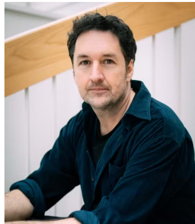
Guy DELISLE

Guy publie la plupart de ses travaux à L'Association, notamment Aline et les autres , suivi en 2001 par Albert et les autres . Dessinant parallèlement la série humoristique Inspecteur Moroni chez Dargaud, l'auteur publie en 2002 Pyongyang , un nouveau récit de voyage lié à son métier d'animateur, cette fois en Corée du Nord, un témoignage précieux sur le pays le plus fermé de la planète. Par son regard à la fois acéré et bienveillant sur une culture étrangère, Chroniques birmanes constitue le prolongement de la série d'ouvrages consacrée à ses séjours en Asie. Avec Chroniques de Jérusalem en 2011, il reprend encore une fois le mode du journal de bord pour raconter son expérience en Israël. L'album remporte le Fauve d'Or du Meilleur Album au Festival d'Angoulême 2012 et se vend à 180 000 exemplaires.