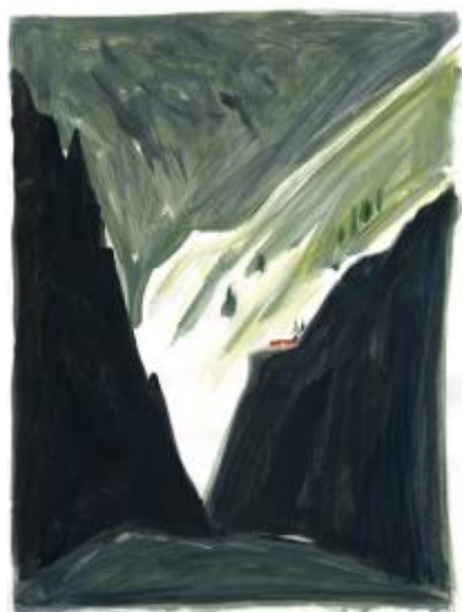
Dominique Corbasson - Dalshnibba Norvège – Gouache sur papier – 50x36 cm

Pour sa nouvelle participation à la Brafa, Dominique Corbasson, fait une nouvelle fois éclater sa palette. Verts luxuriants, roses pétillants, bleus profonds, noirs électriques, rouges vibrants rythment ses œuvres. Audacieuse dans le choix du cadrage, Corbasson multiplie les points de vue. Ses dessins alternent entre plans resserrés et vues éloignées.