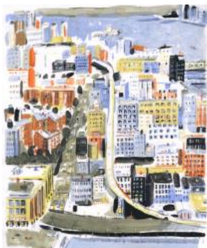
Dominique Corbasson - Hudson River – 61x49 cm – Gouache sur papier - 2013

Quel est le plus court chemin pour se rendre à New York, passer par Paris, Bergen et San Francisco ? Assurément, celui de Dominique Corbasson ! La dessinatrice offre pour la galerie Huberty&Breyné, un nouvel itinéraire coloré en trente peintures. Des gouaches de grands format aux traits fins et enlevés nous conduisent des rives californiennes aux Fjords Scandinaves. Une parenthèse enchantée au cœur de l'hiver !