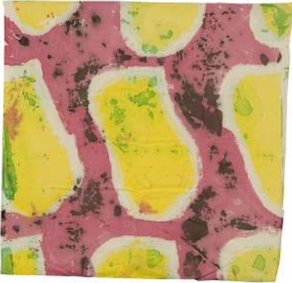
Figure emblématique de la scène artistique contemporaine, Claude Viallat est l'un des fondateurs du mouvement Supports/Surfaces, qui voit le jour en France dans les années 70. Ses recherches artistiques questionnent dès les premières heures, les moyens picturaux traditionnels et le dictat du format imposé par le châssis du tableau. Affranchi des contraintes liées au format académique, Claude Viallat expérimente depuis plus de 40 ans les multiples supports qui s'offrent à lui.

Drap, toile de tente, parachute, bâche, toile de parasol, sont pour lui autant de texture sur lesquelles il appose, de façon quasi-mécanique, la répétition d'un motif unique peint. Sorte de rectangle aux angles courbes, cerné de blanc ou de noir avec un fond aux couleurs saturées, cette forme se multiplie pour mieux déconstruire le tableau. Mêlant répétition du motif et expérimentation du support, son travail explore de façon fortuite l'infinie combinaison formes / couleurs / matières.