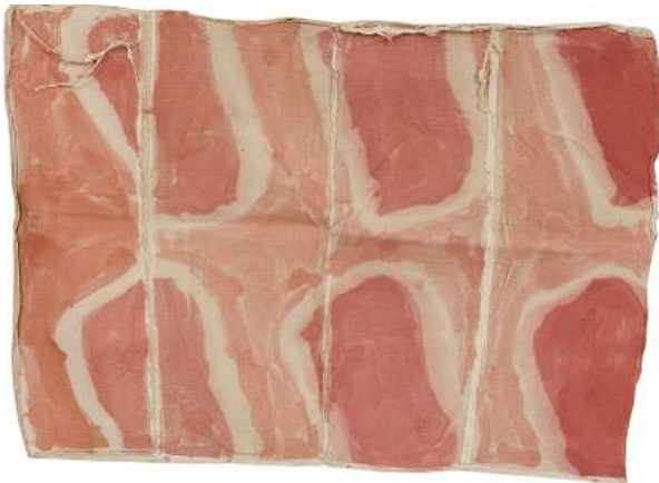
Claude Viallat - Peinture sur bache en tissus