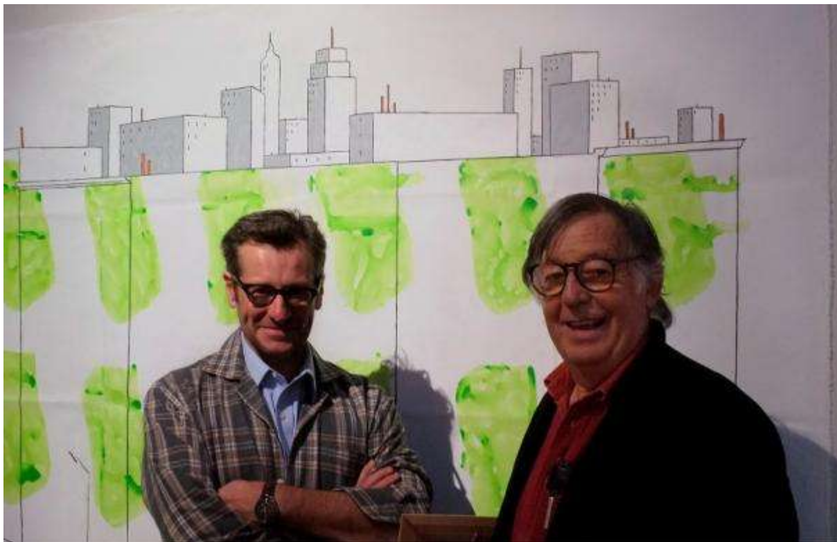
François Avril et Claude Viallat devant une de leurs œuvres réalisées ensemble pour l'exposition « Quelques Instants plus tard... »

* « Quelques instants plus tard... » est une exposition rassemblant près d'une centaine d'œuvres inédites réalisées en tandem par 40 duos d'artistes : 40 artistes majeurs d'art contemporain et 40 des plus prestigieux auteurs de Bande Dessinée. Initiée par la Galerie Petits Papiers et Christian Balmier, cette exposition présentée au couvent des Cordeliers de Paris en octobre dernier est actuellement visible à la cité Internationale de la Bande Dessinée, avant de poursuivre son itinérance à travers l'Europe jusqu'à la fin 2013.