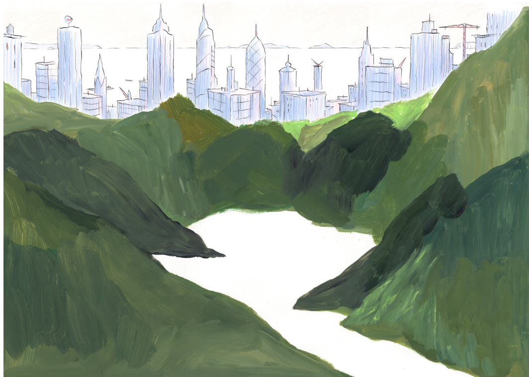
GLORIA et François AVRIL - Le réservoir - 2026 - Acrylique, encre de Chine et crayons de couleur sur papier 49,2 x 68,5 cm

En trait d'union, l'exposition accorde également une place aux créations à quatre mains. Les collaborations entre Dominique CORBASSON et François AVRIL répondent, pour la première fois, avec celles de leur fille. Ce dialogue dessiné entre générations devient un espace de circulation et d'échange.