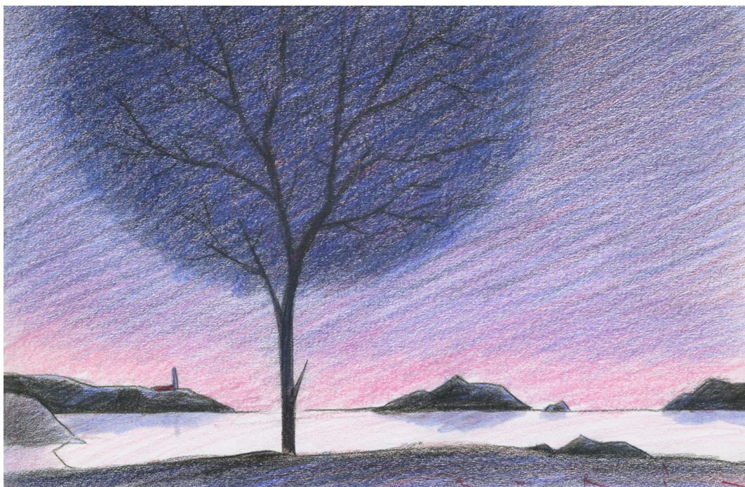
François AVRIL - Evening - 2025 - Crayons de couleur sur papier - 18 x 27,7 cm - Signé en bas à gauche

Qu'il s'agisse d'une ville ou d'un paysage, François AVRIL cherche moins à restituer la réalité qu'à en retenir l'essentiel, laissant au spectateur une totale liberté d'interprétation.