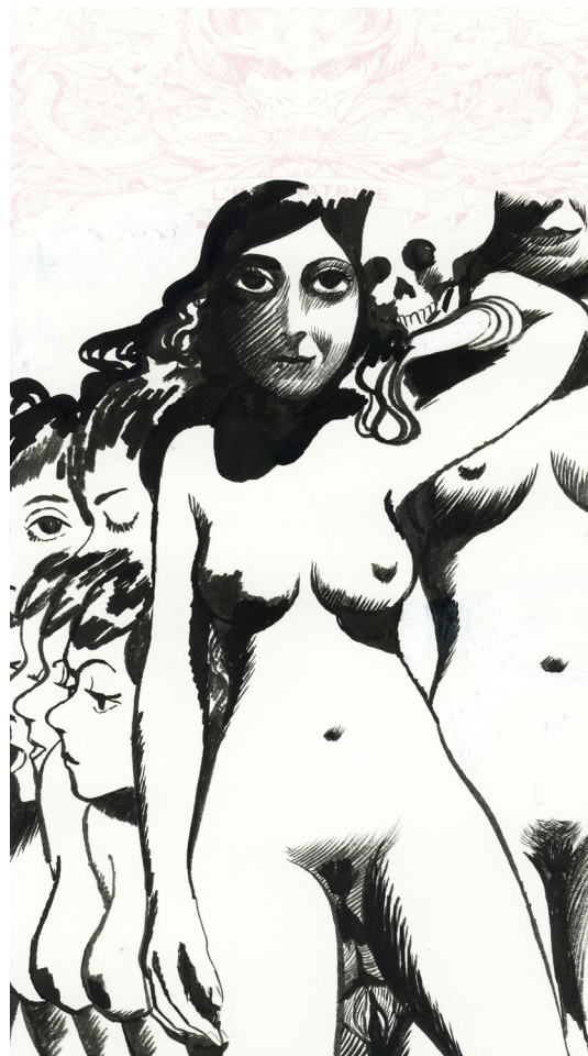
Manuele Fior - N°18 - La Lune , Encre de Chine sur papier, 35,5 x 19 cm, Signé en bas à droite