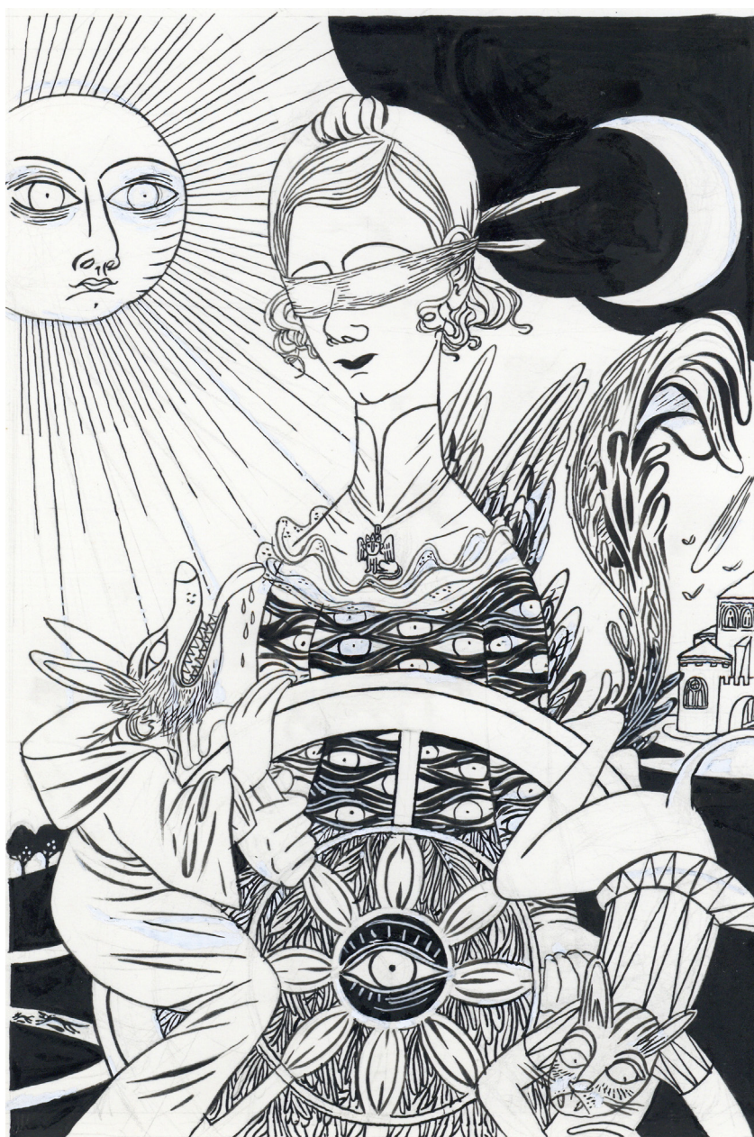
Laureline Mattiussi - N°10 - Roue de la fortune , Encre de Chine sur papier, 27,5 x 18 cm, Signé en bas à droite

Un voyage fascinant à travers les arcanes majeurs et mineurs, où l'art se fait médium.