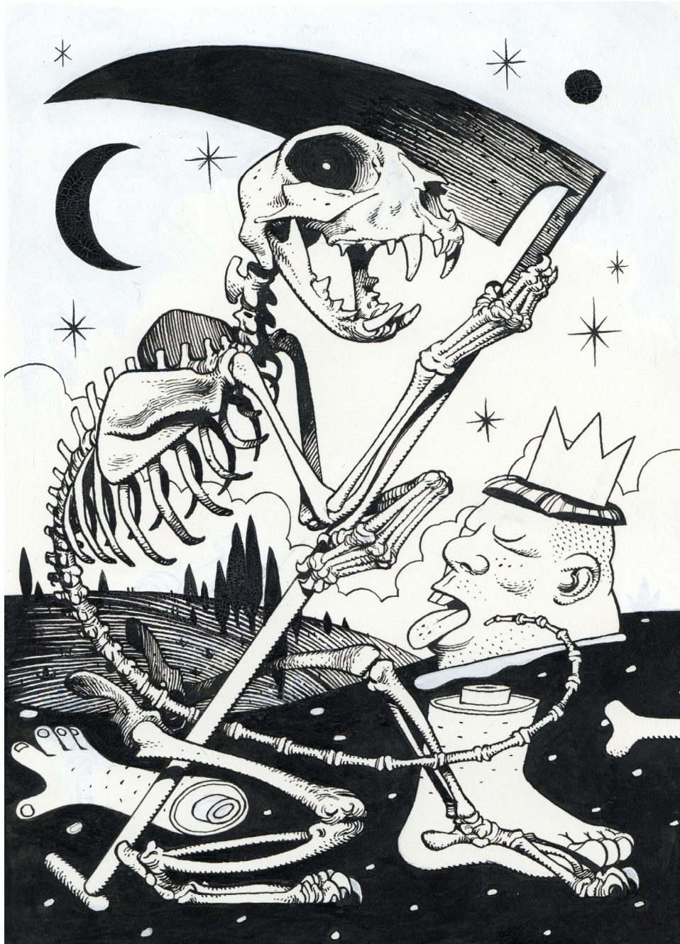
Julien Loïs - N°13 - La mort , Encre de Chine sur papier, 28 x 20 cm, Signé et daté en bas à droite