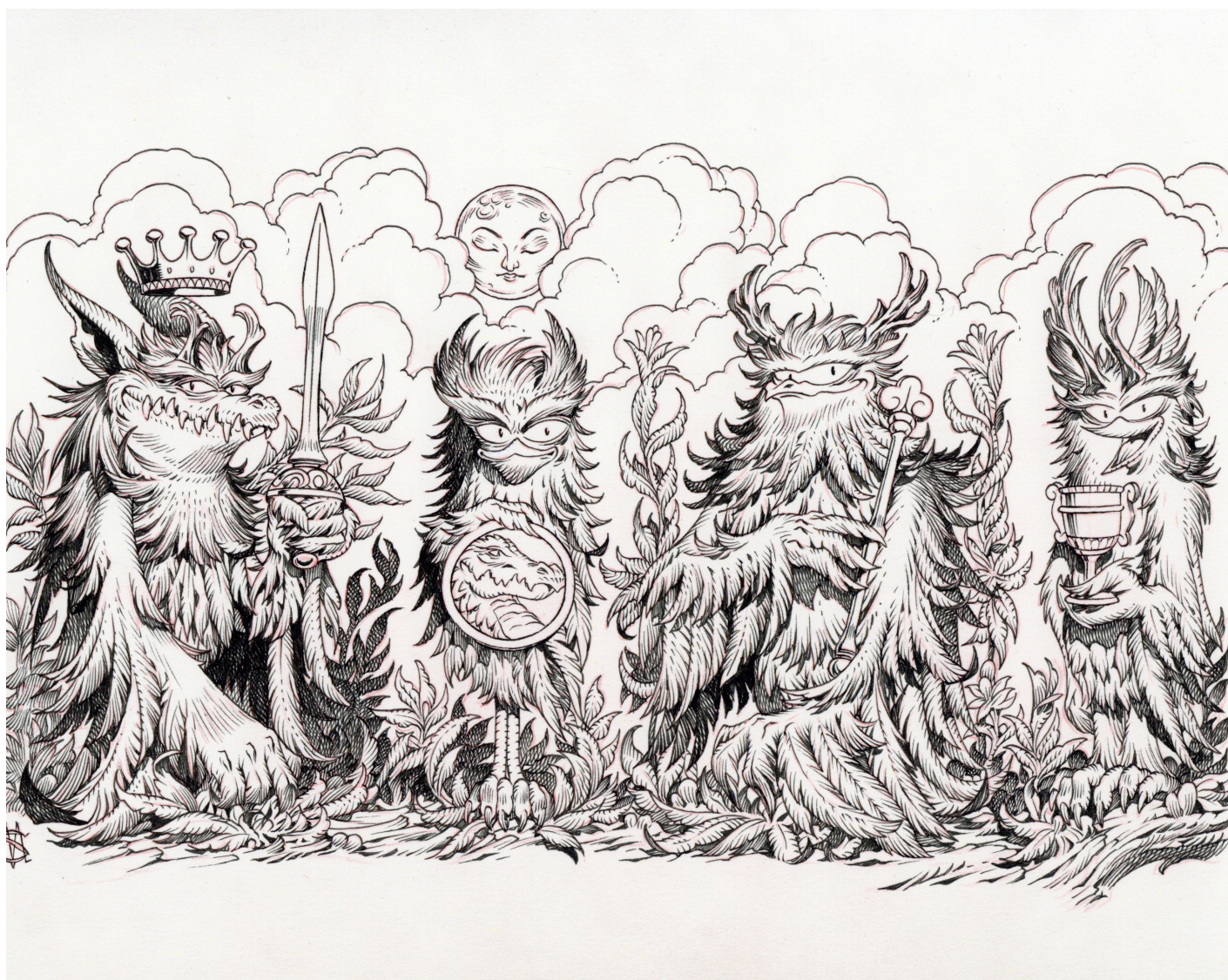
Stan Manoukian - Habillage boitier , Encre de Chine et crayon rouge sur papier, 12 x 22 cm, Signé en bas à gauche