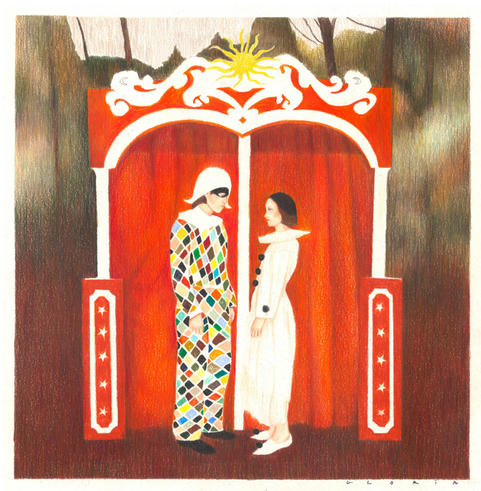
Gloria AVRIL - Comedia -Crayons de couleur sur papier - 25,9 x 25,5 cm - Signé en bas à droite

Le regardeur est invité à voir «à travers» les corps, par le biais d'une gestuelle finement dessinée ou par un subtil jeu de transparence faisant du décor le prolongement d'un état d'âme. Le cadre d'une fenêtre, l'embrasure d'un rideau, l'ouverture d'un grillage, le dehors et le dedans se confondent. Gloria Avril joue avec les ouvertures qui viennent guider l'oeil du regardeur - voyeur, invité à capturer un moment d'intimité. Quelque chose vient d'advenir ou est sur le point de se réaliser, tout est à imaginer dans ce temps arrêté comme une incitation à se perdre dans les méandres de la rêverie et de la contemplation.