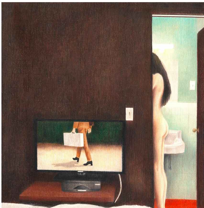
Gloria AVRIL - Mountain Motel -Crayons de couleur sur papier - 40,4 x 39,9 cm Signé en bas à gauche

Inspirée par le cinéma américain de Jim Jarmush ou David Lynch, Gloria Avril semble saisir l'instant - celui de l'intersection d'une lumière et d'un mouvement. Dans le dessin de l'artiste, pas de contours mais une accumulation minutieuse de petits traits vifs et secs créant des jeux de doux gris optiques ou des nuances de couleurs de velour. En contraste, Gloria Avril compose avec un habile travail de réserve. Du blanc du papier immaculé jaillissent la lumière et de rares personnages, figurants égarés dans un monde abandonné. Cette lumière vient heurter la torpeur ambiante pour révéler une présence mystérieuse.