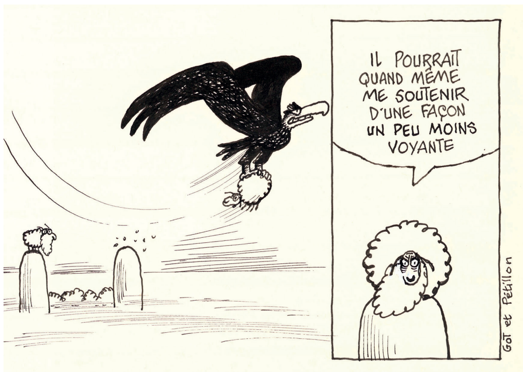
Le Baron Noir, Conversation en vol (détail) - 15,5 x 41,5 cm

L'exposition présente plusieurs de ses planches du Baron Noir , ainsi que quelques dessins de presse et divers dessins humoristiques.