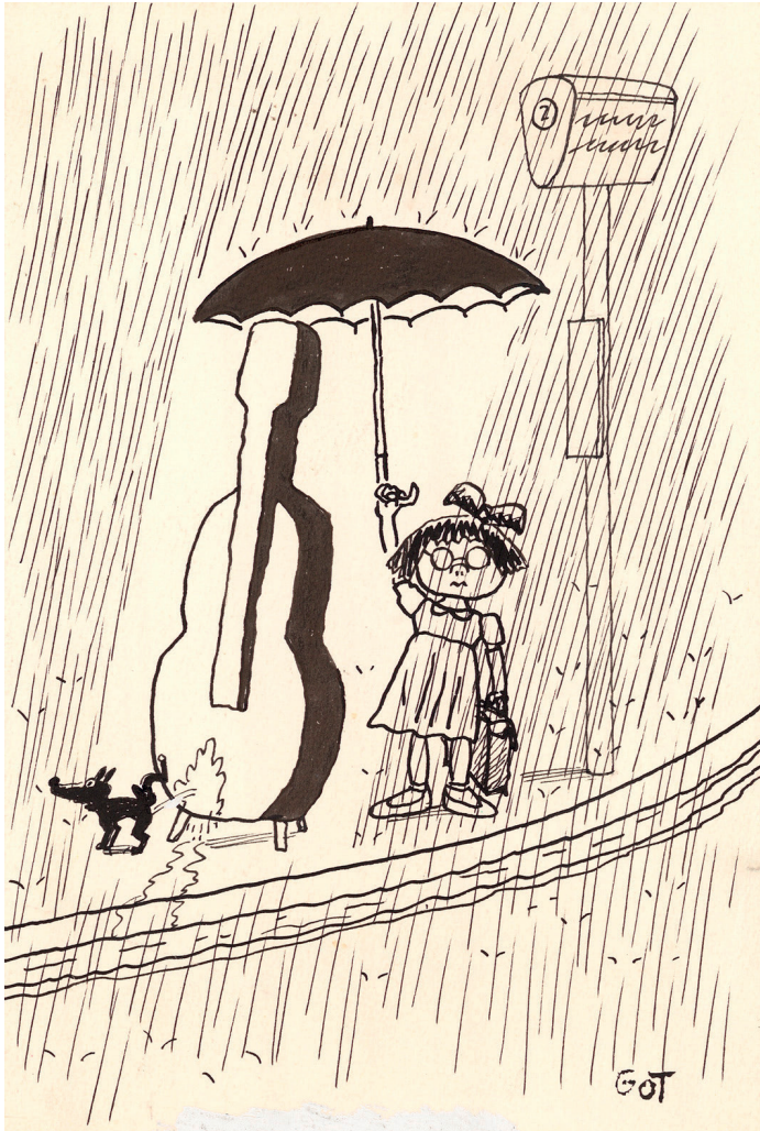
Got 23 - 19,8 x 13,3 cm