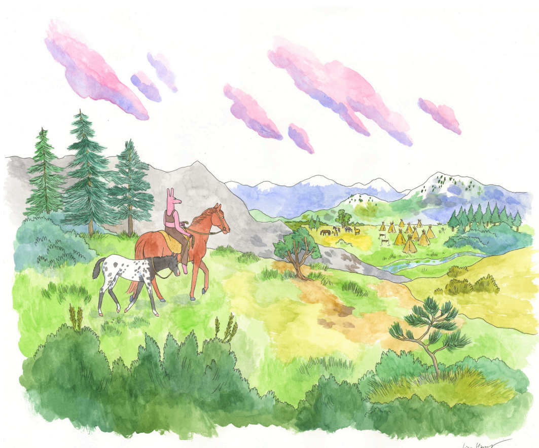
Coyote Doggirl - Returning with a Gift - Encre de Chine et aquarelle sur papier - 15 x 21,5 cm - Signé en bas à droite