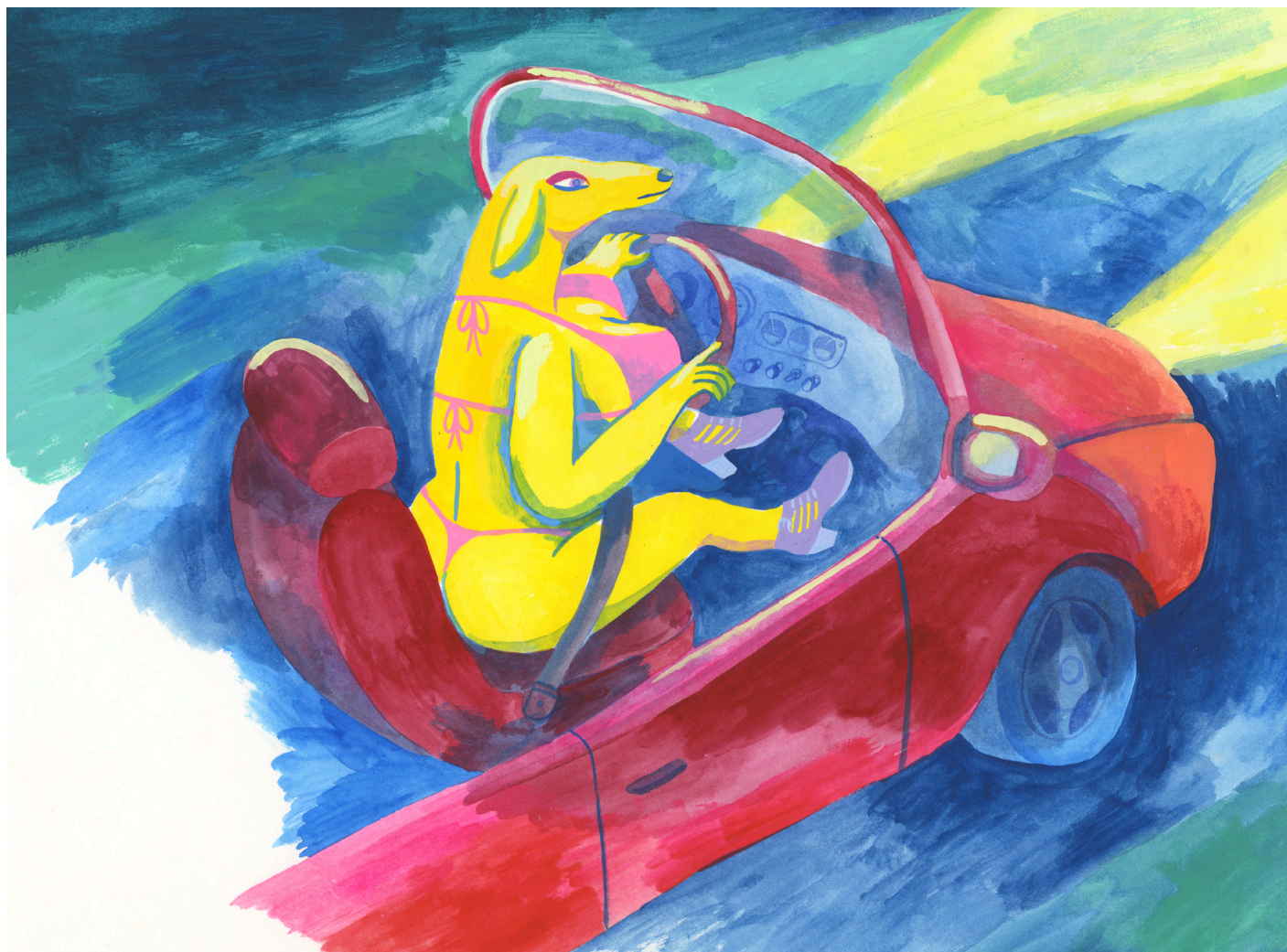
Big Boob Driving Dog - Gouache sur papier - 25,5 x 33,5 cm - Signé en bas à droite