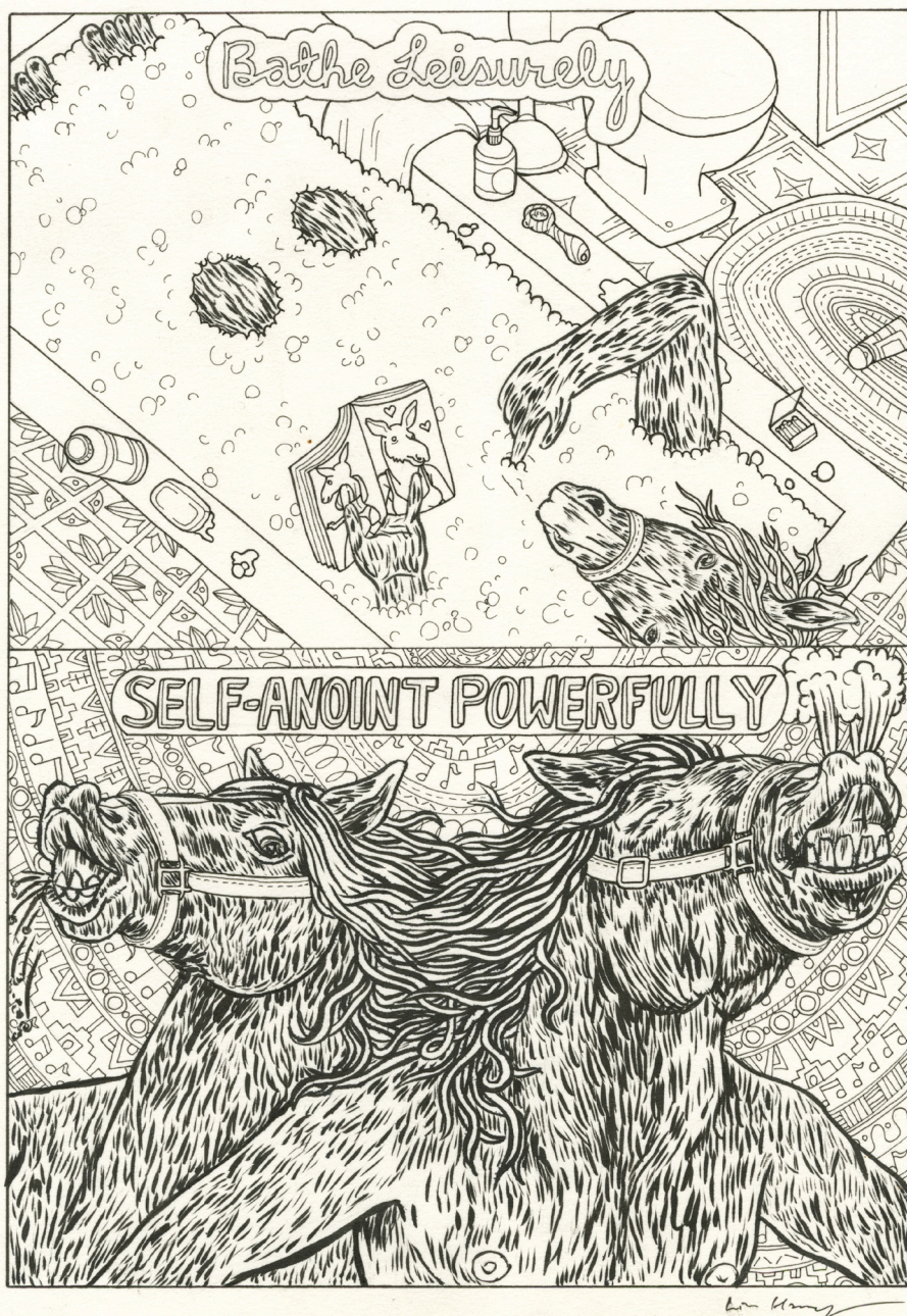
Saturday Night - page 5 - Encre de Chine sur papier - 26,7 x 19 cm - Signé en bas à droite