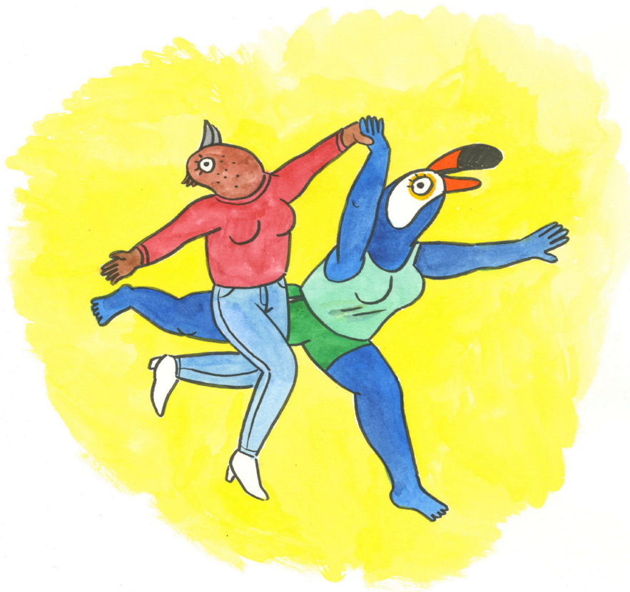
Tuca & Bertie promo 2 - Technique mixte sur papier - 17,5 x 18,5 cm - Signé en bas à droite

En 1994, au détour d'une page de son journal intime, Lisa Hanawalt annonçait : « Un jour, je deviendrai célèbre pour mes dessins de chevaux ». Présage ou prophétie auto-réalisatrice pour cette artiste qui passe du monde underground du fanzinat à celui de production de séries animées pour une plateforme internationale américaine sans jamais délaïsser sa passion pour les équidés. Héritière impertinente de Maurice Sendak, Richard Scarry ou Beatrix Potter, Lisa Hanawalt nous offre un anthropomorphisme pour adulte, devenu, au fil de ses projets, sa patte graphique. Dans l'univers de l'artiste, un toucan excentrique et un moineau anxieux ( Tuca & Bertie ), un cheval aussi cynique que dépressif ( BoJack Horseman ) et des humains en errance traversent ensemble les hauts et les bas de la vie. Les animaux portent des pulls à motifs, les humains se donnent des noms d'oiseaux et l'anxiété profonde flirte avec l'humour léger. Le tout dessine un miroir grotesque et tendre de la condition humaine.