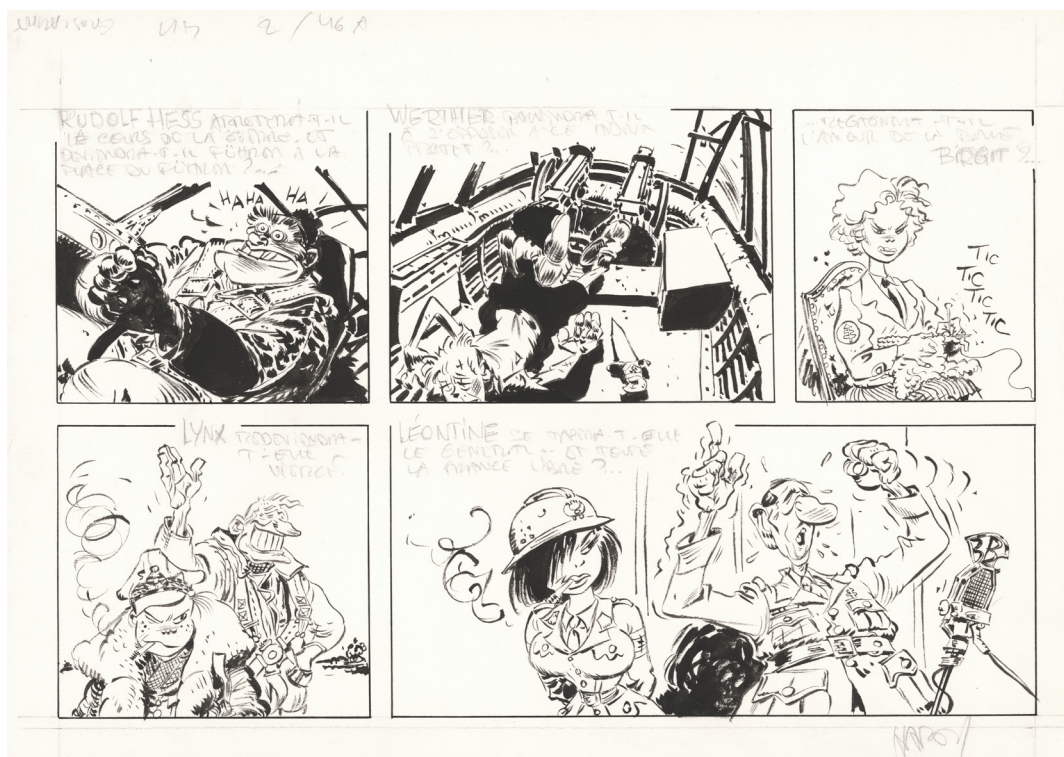
La patrouille des Libellules - Défaite éclair - Tome 2 - Planche 46A - 1987 - Encre de Chine sur papier - 20,2 x 32,7 cm Signé en bas à droite

Réduire Hardy à ce seul succès reviendrait pour autant à ignorer l'aspect le plus audacieux de son œuvre. À ce propos, cette exposition met également particulièrement en lumière ses collaborations avec le scénariste Yann, où l'artiste explore des territoires graphiques plus corrosifs, plus adultes et volontairement provocateurs.