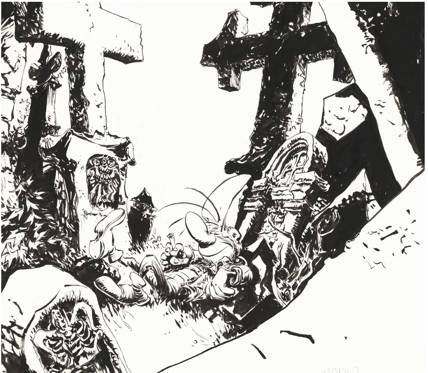
(Détail) Pierre Tombal - Couverture du boîtier sérigraphié du tirage de tête du Tome 17 - Encre de Chine sur papier - 47,5 x 36 cm - Signé en bas à droite