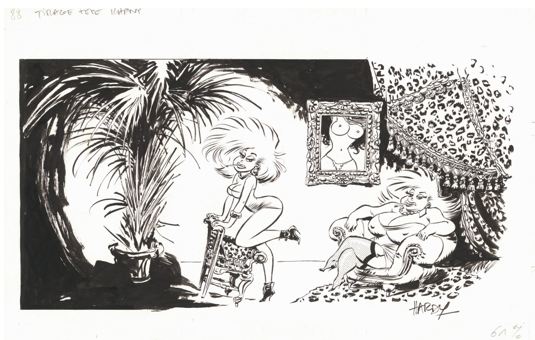
Lolo & Sucette - Illustration pour le tirage de tête Khani - Encre de Chine sur papier - 17 x 33 cm - Signé en bas à droite

Cette série demeure aujourd'hui l'une des propositions les plus atypiques et audacieuses de la bande dessinée franco-belge des années 1980-1990. Cette rétrospective entend ainsi montrer toute l'étendue du talent de Marc Hardy: un dessinateur capable d'allier maîtrise classique et énergie punk, tradition franco-belge et irrévérence contemporaine. Héritier de l'école de Spirou , il en détourne pourtant les codes avec une liberté rare, faisant de son œuvre un territoire unique, traversé par l'humour noir, la satire, l'érotisme, le grotesque et une virtuosité graphique constante. À travers cette exposition, la galerie souhaite rendre hommage à un artiste essentiel, dont le travail continue d'influencer de nombreux auteurs contemporains et dont les planches originales révèlent, plus encore que les albums imprimés, la puissance graphique, la précision du trait et l'incroyable vitalité narrative.