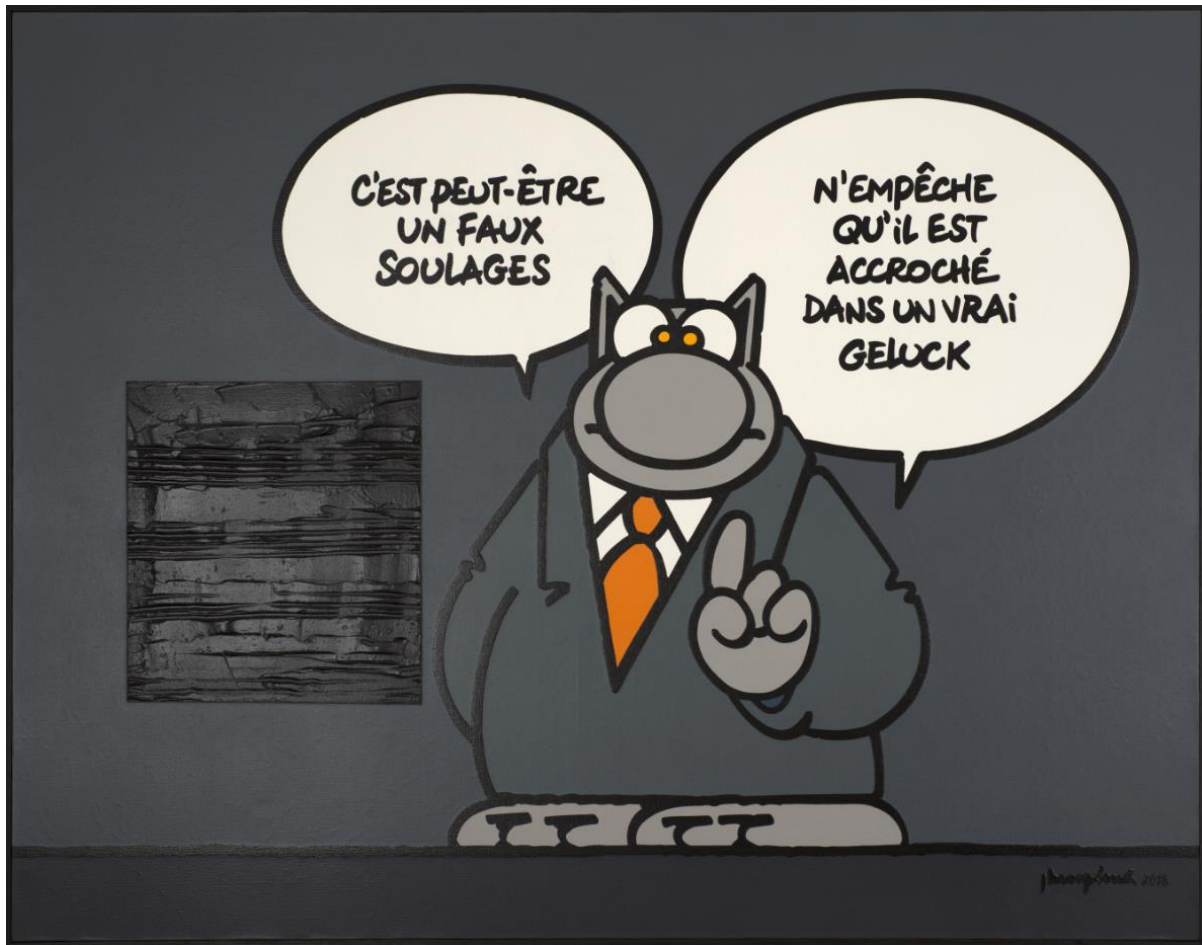
Philippe GELUCK - Faux Soulages - Acrylique sur toile -162 x 114 cm

Pour sa deuxième participation à Art Elysées, Huberty & Breyne Gallery laisse carte blanche à l'un de ses artistes phares : Philippe Geluck. Devenu une icône incontournable de la Bande Dessinée, le Chat s'installe sur la mythique avenue parisienne pour déployer son humour acéré et se rire des codes de l'Art et de son histoire. A travers une série de toiles, de dessins originaux, de sculptures ou de sérigraphies, le matou s'expose sous toutes les coutures et n'épargne personne. De Christo à Lichtenstein, en passant par Soulages, Munch ou encore Fontana, tout le monde en prend gentiment pour son grade.