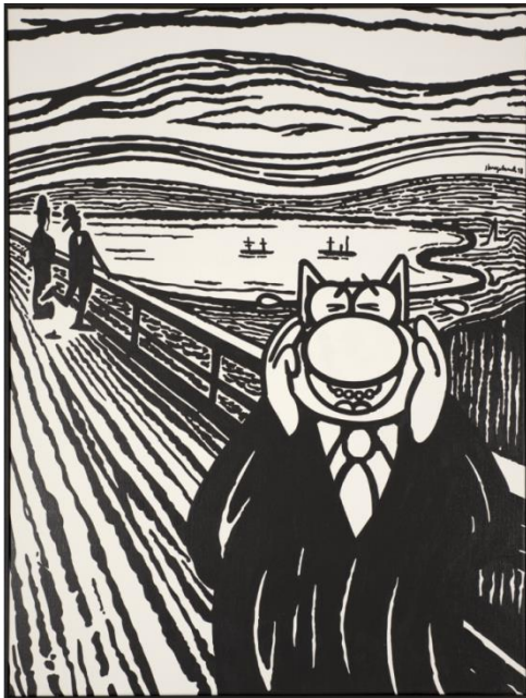
Philippe - Le Rire de Munch Acrylique sur toile - 90 x 120 cm

A travers ses toiles, Philippe Geluck chatouille hors les cases la perception de l'art moderne. Qu'il mette en abyme l'origine du monde de Gustave Courbet, parodie le pop art de Roy Lichtenstein, interroge l'expressionnisme abstrait de Jackson Pollock ou lacère le spatialisme de Lucio Fontana, c'est toujours avec un sourire en coin. Ses œuvres sont autant d'hommages piquants aux maîtres de la peinture contemporaine. Le Chat prend aussi la pose pour des sculptures de résine ou de bronze, jouant au "Chaltérophile" ou au Discobole. Rien n'est sacré ni formaté sous le trait de Philippe Geluck. S'il détourne les chefs-d'œuvre, c'est avec tendresse et admiration, pour nous inviter à en tirer de nouveaux plaisirs inattendus. Peintures grand format, dessins originaux, sculptures et sérigraphies, le Chat s'exprime sous toutes les formes et n'épargne personne de son humour ravageur.