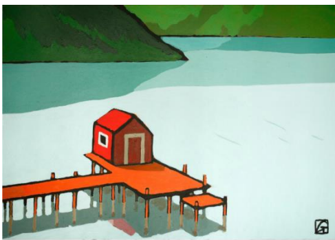
Jean Claude GÖTTING - Paysage XVII 2018 - Acrylique sur toile - 89x116cm

Jean-Claude Götting dévoile pour Art Elysées ses dernières créations. Sens du cadrage, harmonie des couleurs, lignes gracieuses, les œuvres de Götting invitent à la rêverie. De son trait noir, il explore de vastes paysages dont il capte tour à tour la fraîcheur et la douceur de vivre qu'il restitue dans ses toiles avec de grands aplats de couleurs vibrantes. La figure féminine, sujet cher à l'artiste sera également à l'honneur à travers une série de dessins grand format.