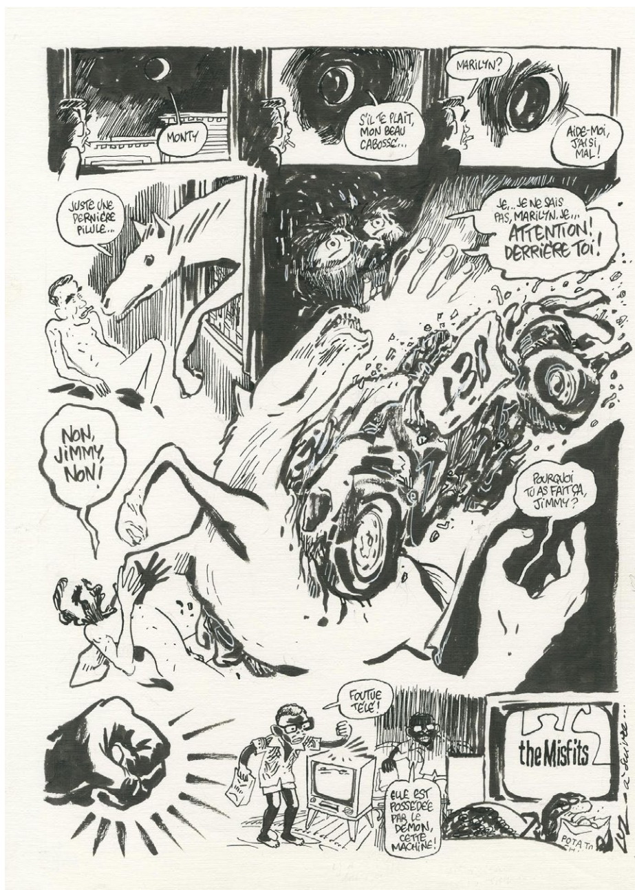
Planche 4 Encre de Chine sur papier, 42x30 cm