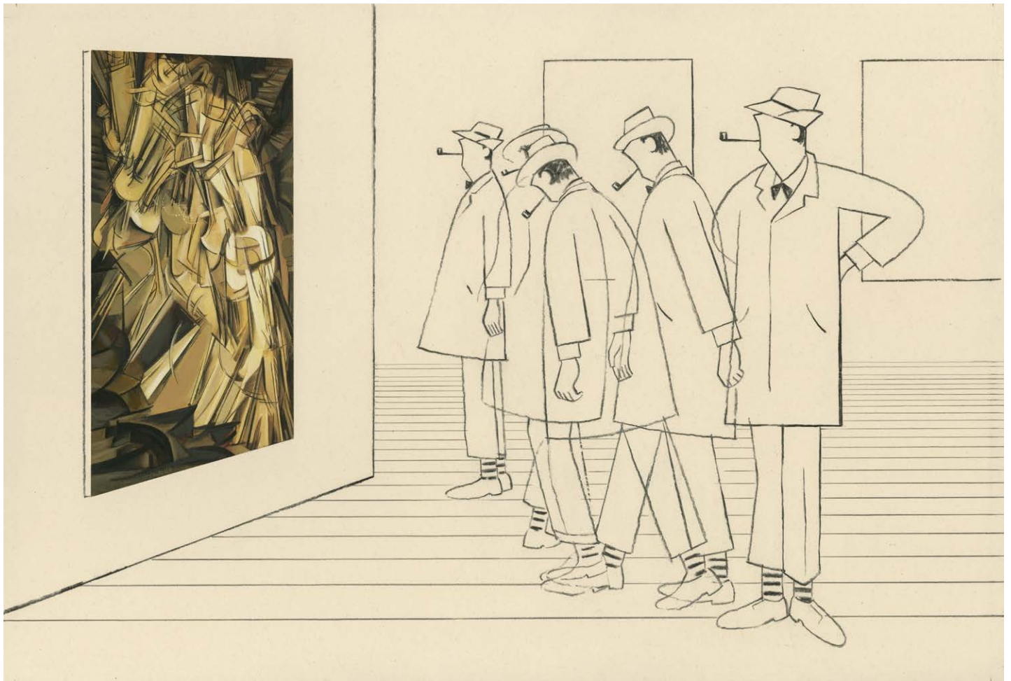
M.Hulot et Duchamp Technique mixte sur papier, 42x61,5 cm