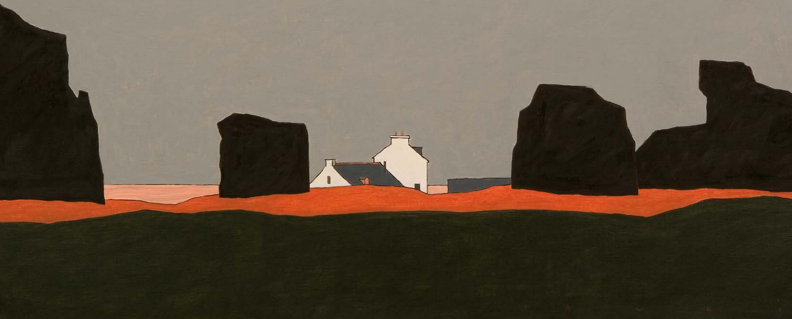
Les roches noires Acrylique sur toile