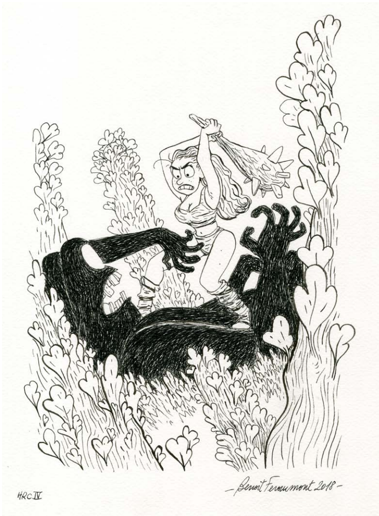
Hommage à Richard Corben Encre de Chine sur papier, 35x27 cm