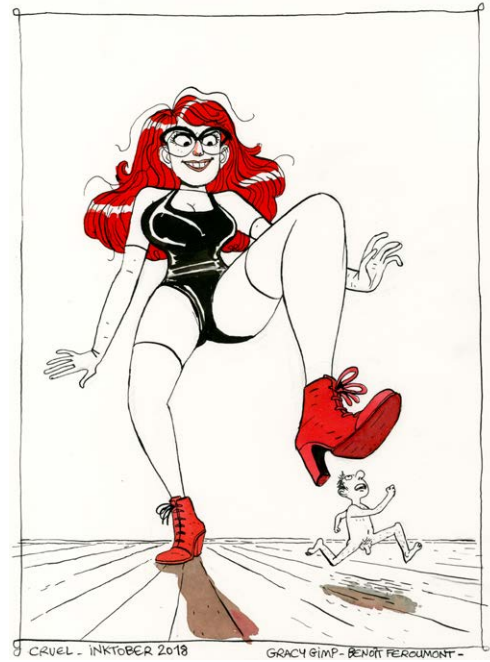
Inktober 2018 – Cruel Encre de Chine et de couleur sur papier, 32x24 cm