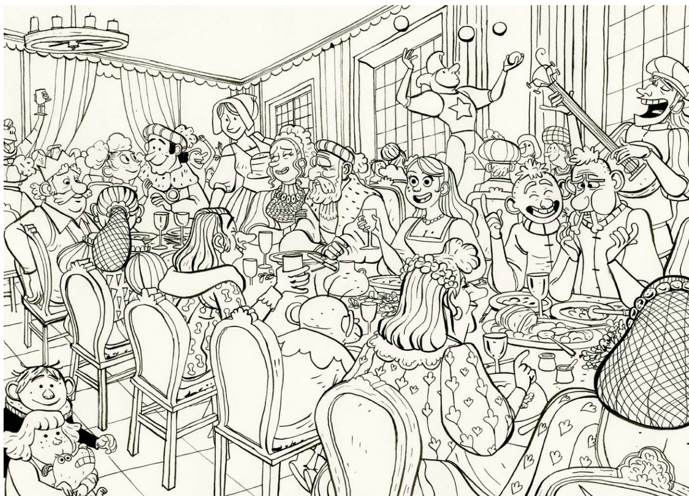
Le Royaume – Tome 7 – Planche 103 (détail) Encre de Chine sur papier, 24x50 cm