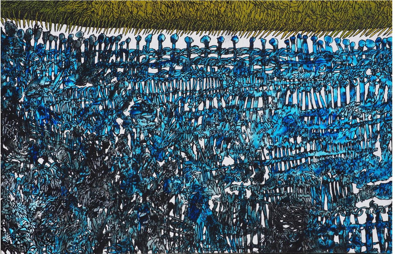
Bault Clôtures électriques sur marécage