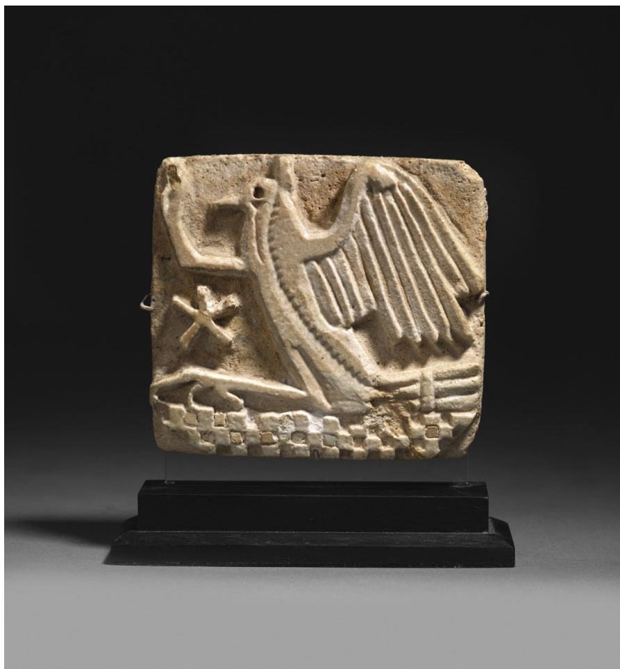
Galerie David Ghezelbash Rekhyt