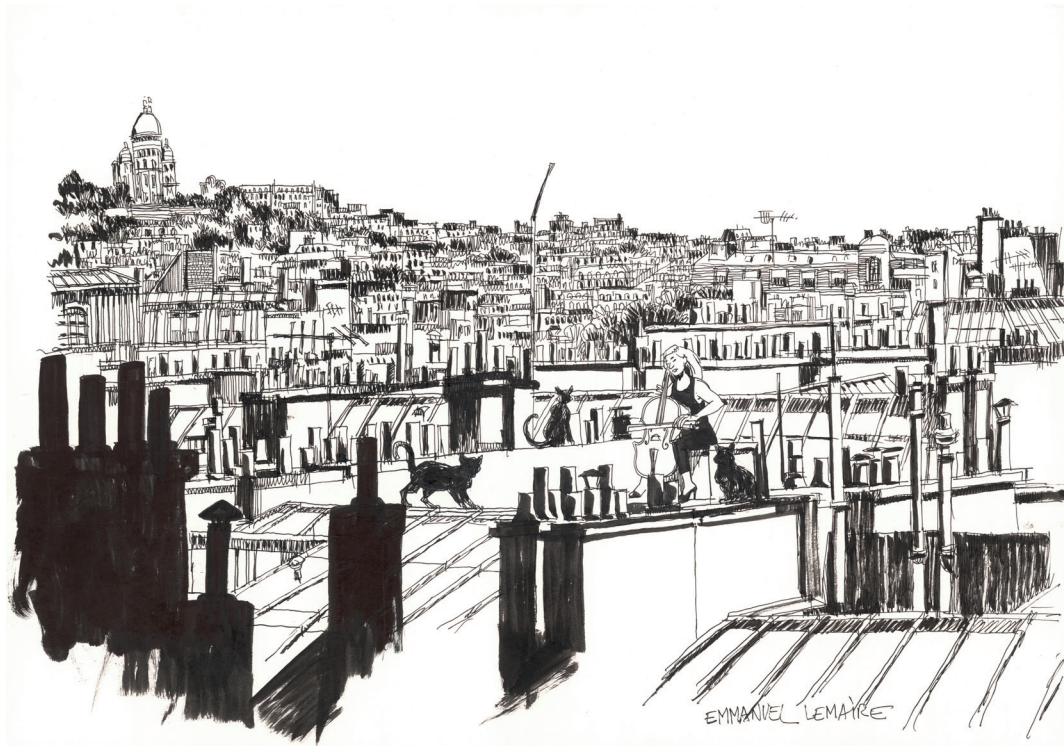
Alain Beulet, Paris et les chats - 2024 - Indian ink on paper - 25,7 x 42 cm Signed on bottom right and dated on the back