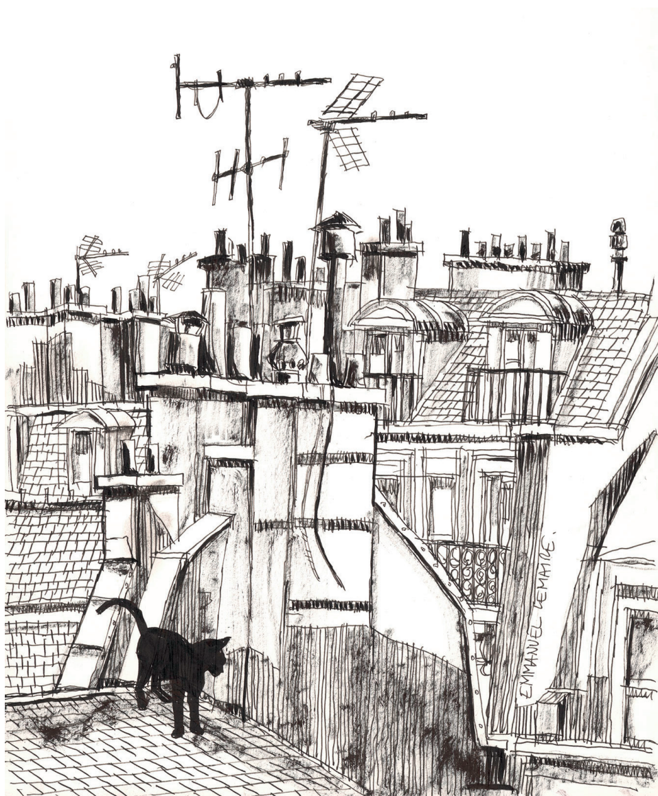
Deux antennes sur un ciel blanc - 2024 - Indian ink on the back - 23,5 x 20,8 cm Signed bottom right