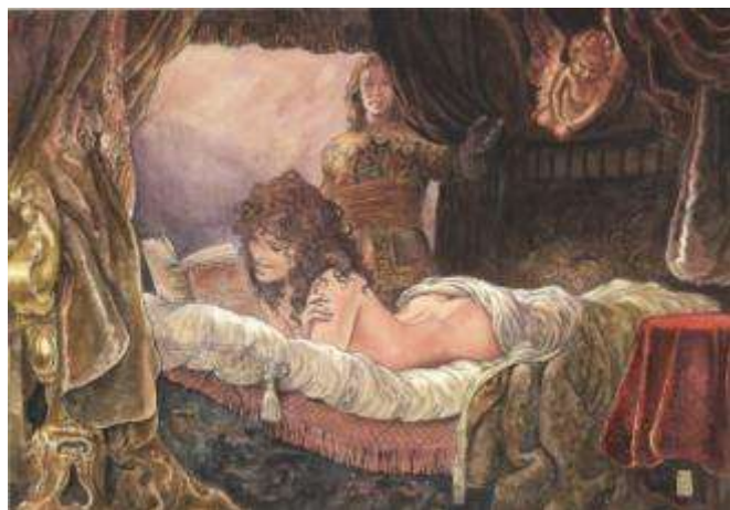
Milo Manara – Couverture des Contes Erotique 2011

« Il est un jeu divertissant sur tous, Jeu dont l'ardeur souvent se renouvelle ; Ce qui m'en plaît, c'est que tant de cervelle N'y fait besoin, et ne sert de deux clous. Or, devinez comment ce jeu s'appelle. Vous y jouez, comme aussi faisons-nous : Il divertit et la laide et la belle : Soit jour, soit nuit, à toute heure il est doux ; Car on y voit assez clair sans chandelle. Or, devinez comment ce jeu s'appelle. Le beau du jeu n'est connu de l'époux ; C'est chez l'amant que ce plaisir excelle : De regardants, pour y juger des coups, Il n'en faut point, jamais on n'y querelle. Or devinez comment ce jeu s'appelle »