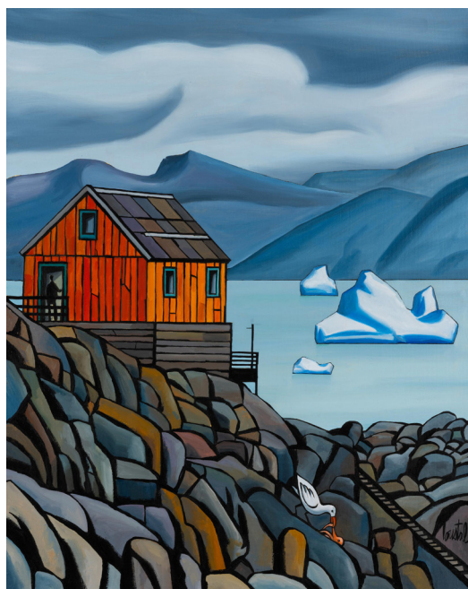
LOUSTAL - Sans titre - 2024 - Huile sur toile - 92 x 73 cm Signé en bas à droite

Oserait-on dire que la peinture de Loustal est un antidote à la morosité ? Cette exposition met en avant une nouvelle suite de toiles, mais pas seulement. C'est également l'occasion de présenter une sélection de dessins en noir et blanc réalisés pour le livre Ciné-roman paru ce mois-ci chez Zanpano. Avec beaucoup d'humour, Loustal se délecte des rapports du texte et de l'image en célébrant l'esthétique de la série B des années 1950.