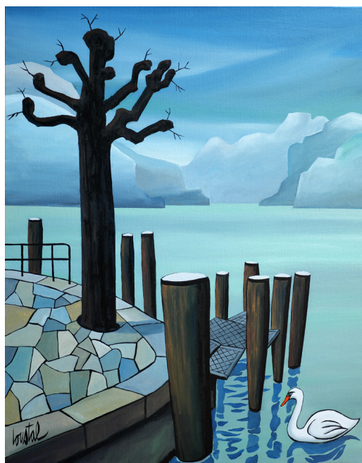
LOUSTAL - Sans titre - 2024 - Huile sur toile - 92 x 73 cm Signé en bas à gauche