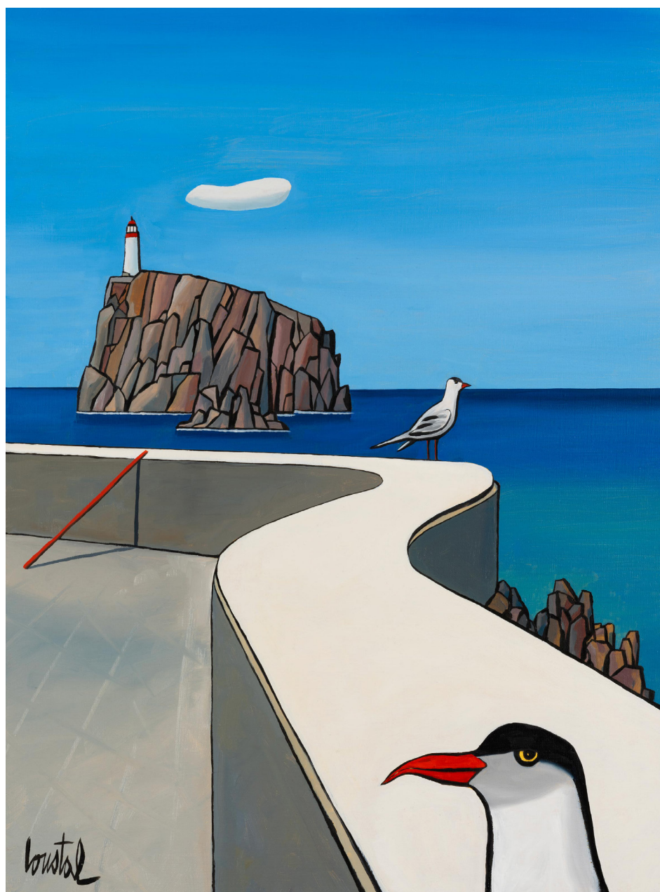
LOUSTAL - Sans titre - 2024 - Huile sur toile - 92 x 73 cm - Signé en bas à gauche

Loustal voyage. Il prend des notes. Il croque des lieux. Il saisit des silhouettes. Il capte le vivant. En photo ou en croquis, sur le motif, il compose déjà des images. Celles-ci se retrouvent dans ses carnets, sur des disques durs. Revenu dans son atelier, ces expériences mûrissent doucement. Elles vont de pair avec ses envies d'images et de peinture. D'une réalité parfois surprenante, chaleureuse ou froide, toujours intrigante, Loustal en fait des œuvres.