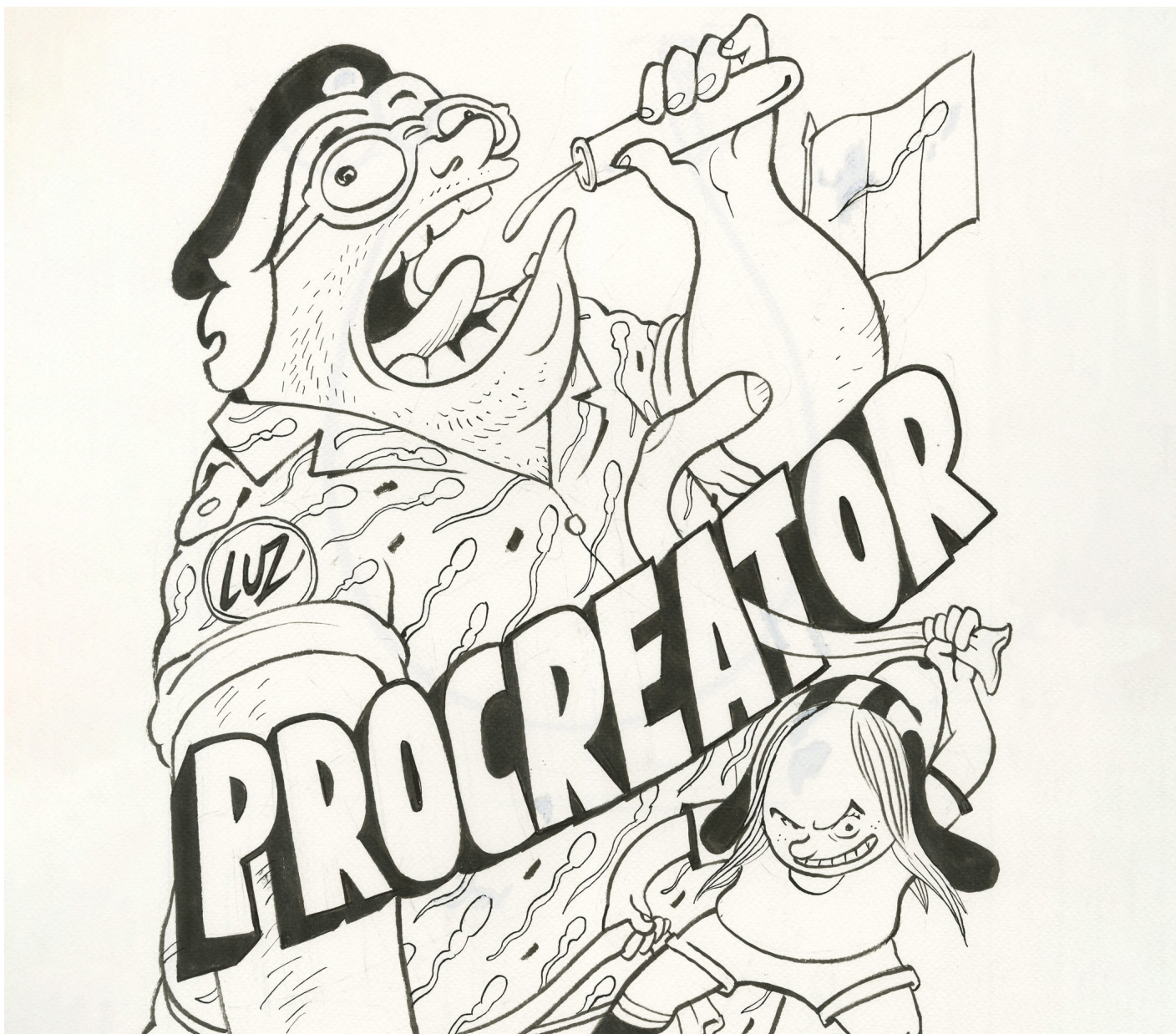
Procreator - 2026 - Couverture de l'album - Encre de Chine sur papier - 39,5 x 30 cm - Signé en bas à droite