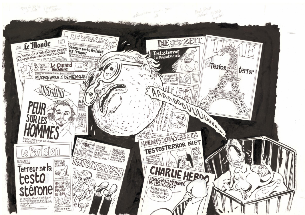
Testosterror - 2023 - Page 152 et 153 - Encre de Chine sur papier - 46,5 x 68 cm

Après s'être consacré un temps à la création de Deux filles nues , très justement récompensé à Angoulême en 2025, Luz s'empare de la thématique du réarmement démographique, et plus particulièrement de celle de la fertilité masculine. En reprenant le parcours de la même famille que dans le premier opus, et en présentant de nouveaux personnages immédiatement identifiables, l'artiste approfondit dans Procréator le sujet des injonctions aussi bien que des érections. Et c'est tout aussi grinçant que la fois précédente.