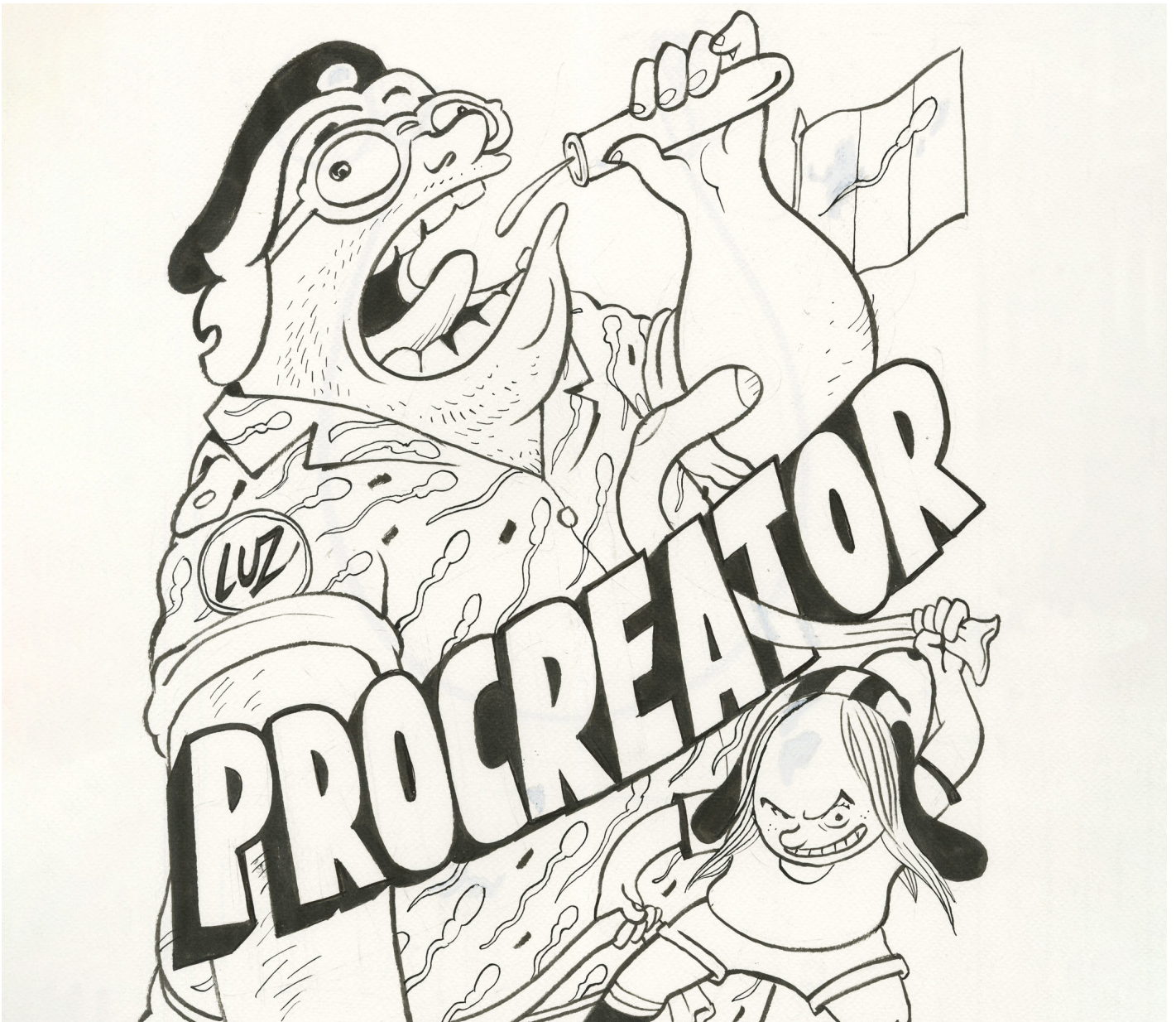
Procreator - 2026 - Couverture de l'album - Encre de Chine sur papier - 39,5 x 30 cm - Signé en bas à droite