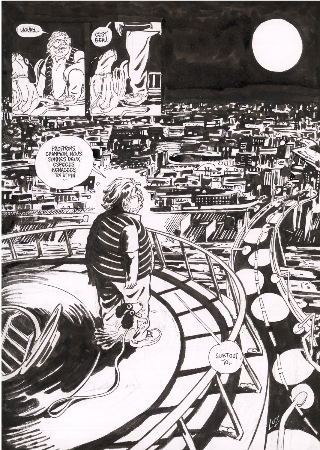
Testosterror - 2023 - Page 186 - Encre de Chine sur papier - 42 x 29,7 cm - Signé en bas à droite